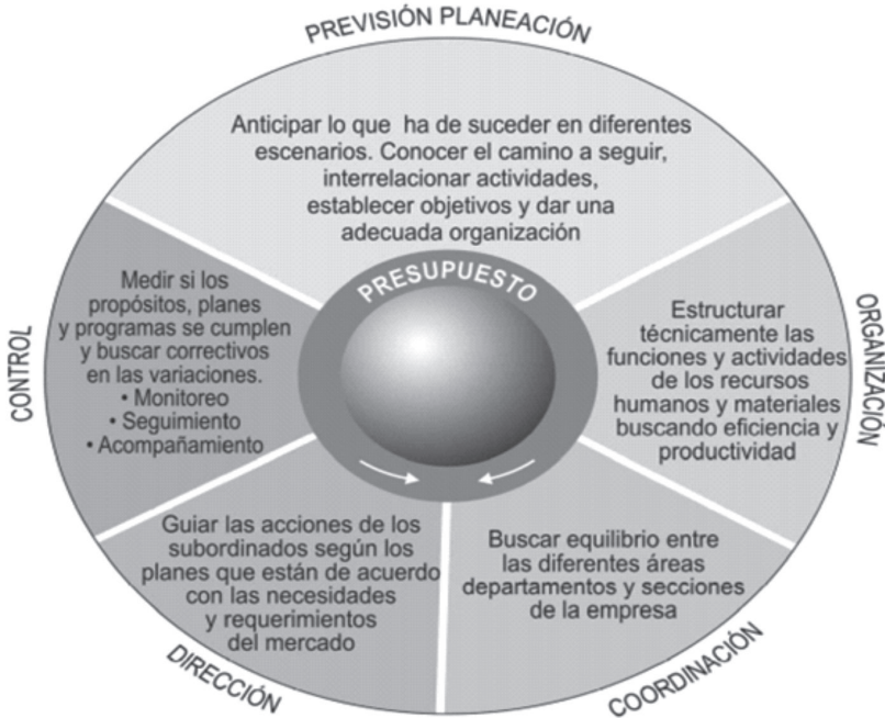
Ilustración 3. El Presupuesto y las funciones administrativas