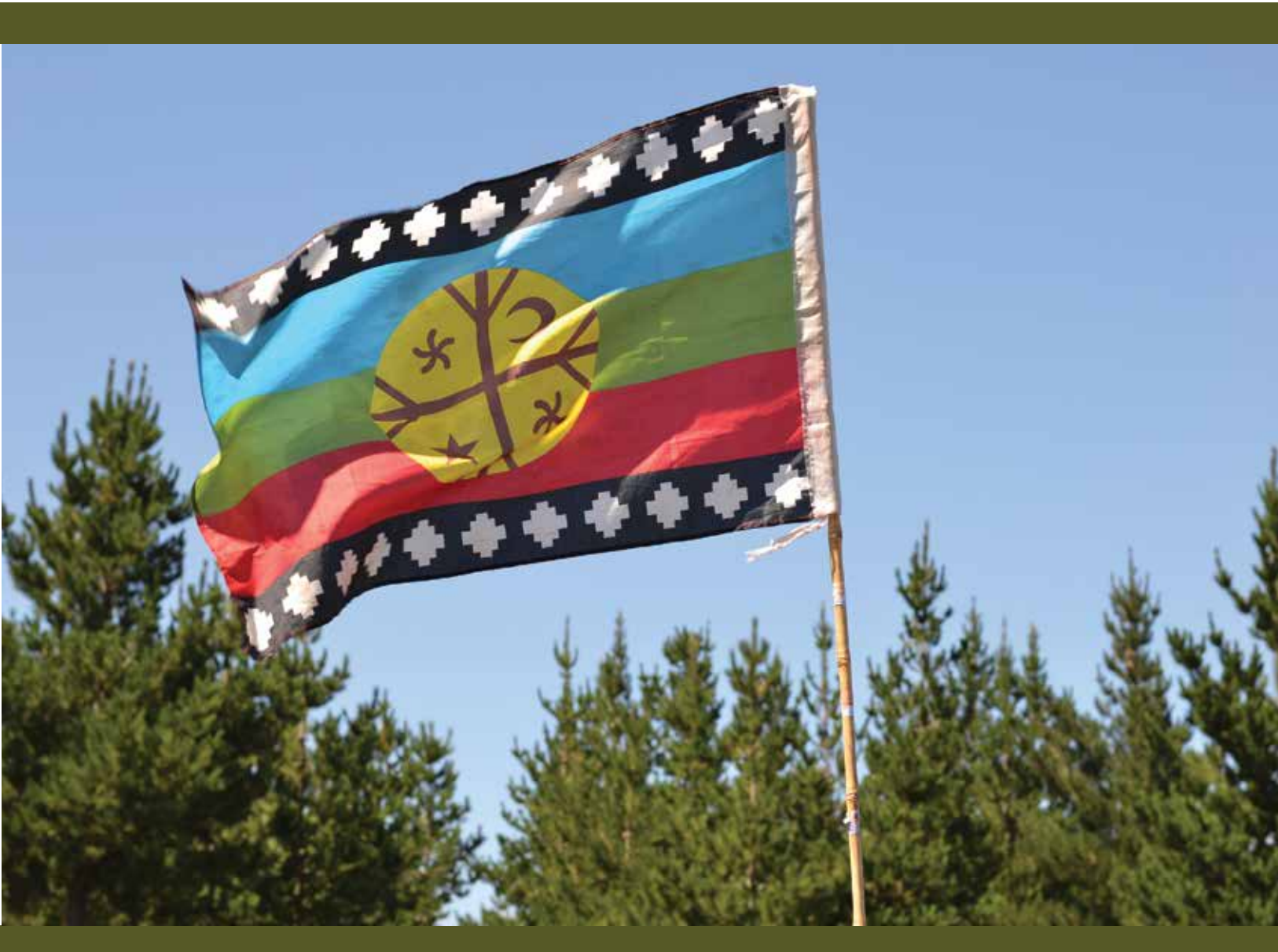
Bandera Mapuche. Chile, Enero del 2016.