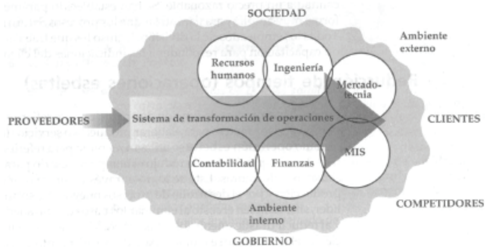
Figura 1. Relación de las operaciones de la organización con su ambiente