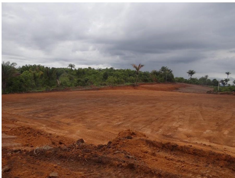
Figura 4: Área onde será construída nova escola, centro comunitário e campo de futebol, comunidade de Santarenzinho, Rurópolis, Oeste do Pará