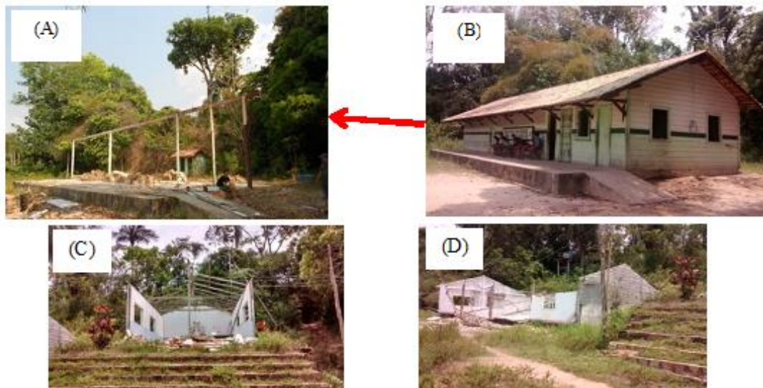
Figura 2: Fotografias da escola (A), igreja (C), sede derrubada (D), a nova escola improvisada (E e F) e também a fotografia da escola, antes da destruição (B).

Fonte: As fotografias (A) registradas por Jane Silva/IBASE e as fotografias (B), (C) e (D) registradas por Elmara Guimarães/CPT-Prelazia de Itaituba (fotografias registradas em setembro de 2017). Pesquisa de campo integrada.