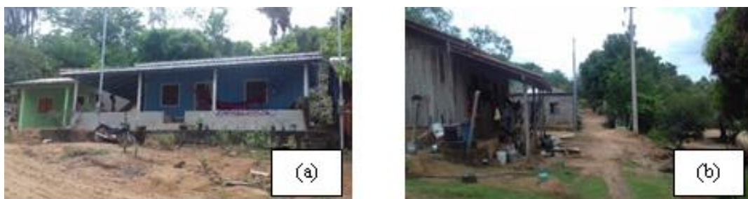
Figura 1: Fotografias da comunidade de Santarenzinho, oeste do estado do Pará

Fonte: Fotos (a) e (b) dia 8 de dezembro de 2019