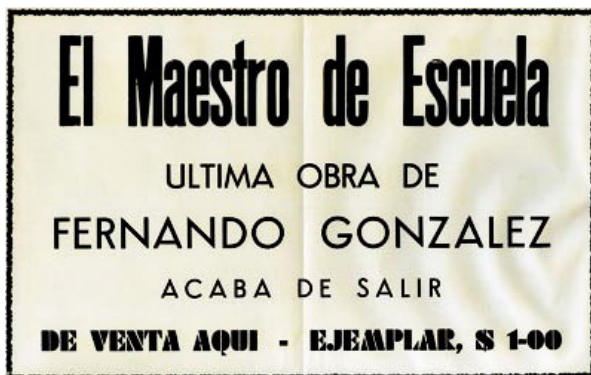
Figura 1: Afiche ubicado en 1941 en la Librería La Pluma de Oro