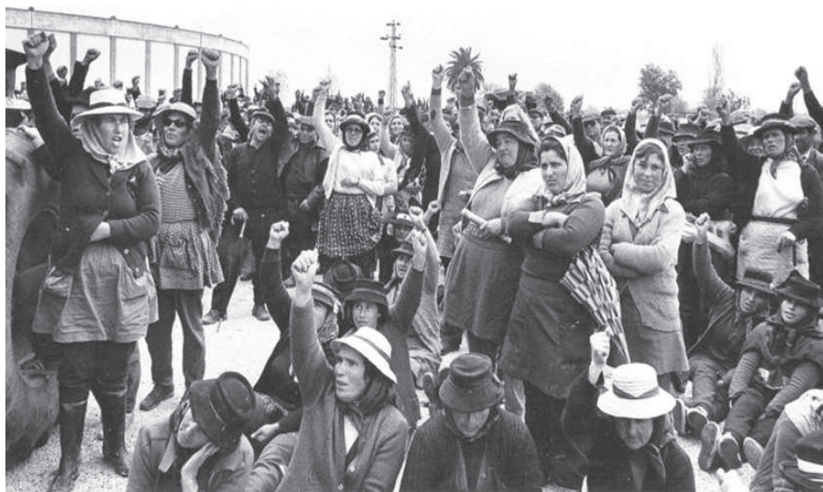
Foro 6.- Campesinas de la Reforma Agrária.

eran mujeres (41'76%). Y es que las mujeres siempre tuvieron un papel importante en todo el proceso de la Reforma Agraria, el trabajo agro-ganadero, en las ocupaciones y en la lucha contra las incautaciones, siendo muchas veces la vanguardia en los enfrentamientos con la GNR y los "agrarios".