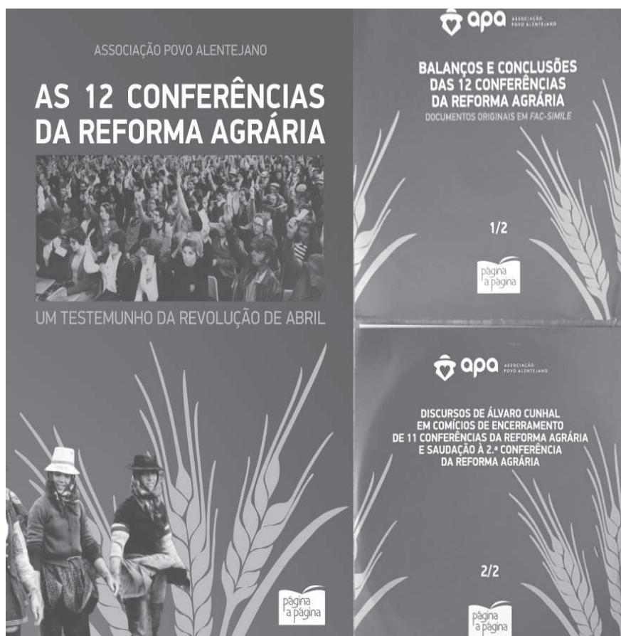
(Foro 3.- Portada publicación AS 12 CONFERÊNCIAS DA REFORMA AGRÁRIA)

Silva, foi aprovada a Lei 86/95, de 1 de Setembro, que constituiu a verdadeira certidão de óbito da Reforma Agrária 222 .