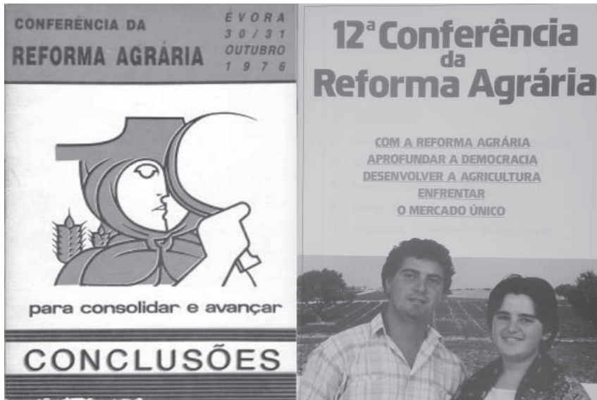
Foto 4.- Primera y última Conferencia de la Reforma Agraria

Agrária, a ofensiva que os governos locais dos agrários e do imperialismo lhe foram movendo, e a luta desta que foi “a mais bela das conquistas de Abril” 225 .