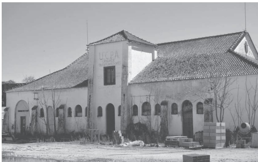
FOTO 9.- Abandono de instalaciones de la UCP Agrícola de Unidade Trabalhadores, de Campo Maior

Pero, a pesar de todo, algunos “históricos de la utopía” aún mantienen la esperanza. A una entrada de mi blog 280 sobre la Reforma Agraria en los campos del Sur portugués, recibía la siguiente reflexión: