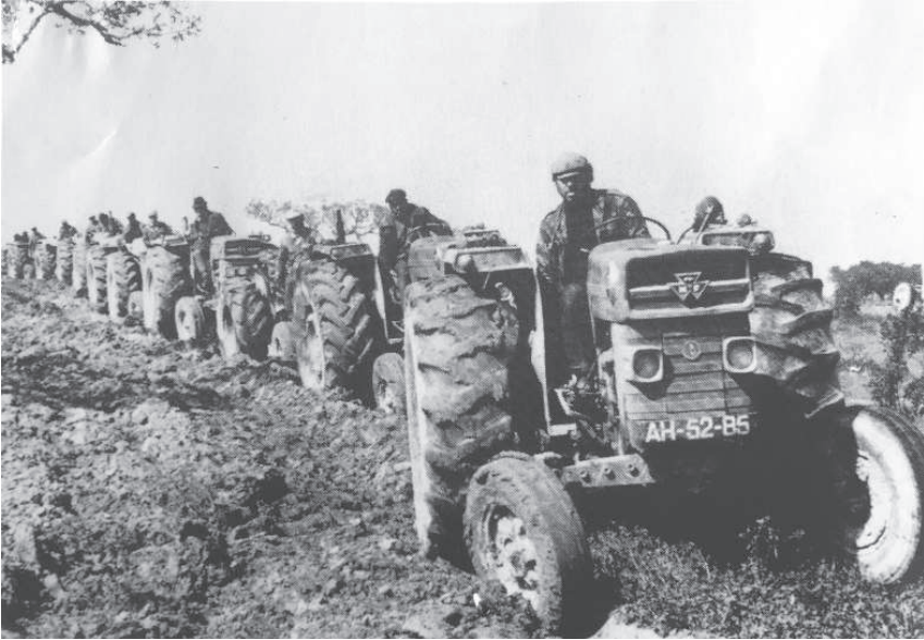
(Foto 1.- Tractores en ocupación de tierras. Reforma Agrária)

manifestación de clausura de más de 30.000 personas, presidida por el Secretario General de los comunistas, siempre líder incuestionable, Álvaro Cunhal. Cuando Spínola realice el fallido Golpe de Estado del 11 de marzo, contra la “política revolucionaria” del Gobierno de Vasco Gonçalves, la gran aspiración del campesinado acelera un ritmo que hasta entonces había sido pausado y tuvo importancia secundaria en el Parlamento: las Bases Generales de la Reforma Agraria se aprobarán el 15 de abril de 1975 202 bajo un IV Gobierno Provisional, siendo Ministro de Agricultura Fernando de Oliveira Baptista, claramente convencido de la necesidad de una Reforma Agraria radical y del reparto de las tierras expropiadas (parecido a lo que había ocurrido en España, pues tras el levantamiento reaccionario del General Sanjurjo de 10 de agosto de 1932, se aceleran los trámites de la Ley de Bases de la Reforma Agraria, publicándose el 9 de septiembre de 1932) 203 .