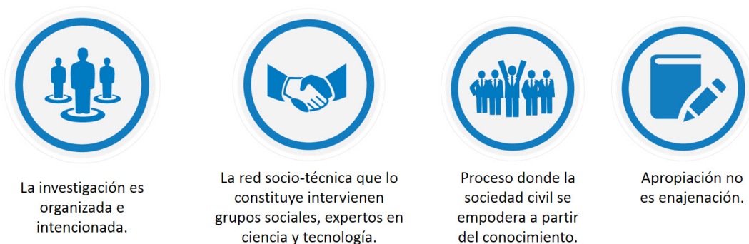
Figura 1. Características de la convivencia escolar y solución de conflictos, mediante el uso de la TIC

La convivencia escolar y solución de conflictos, mediadas por las TIC, implican una percepción de intereses divergente, implica frecuentemente un grado de incompatibilidad percibida por las partes, en relación a los objetivos o a los medios utilizados para alcanzarlos. Independientemente del nivel de análisis, las partes tienden a percibir de manera distorsionada el problema que las enfrenta.