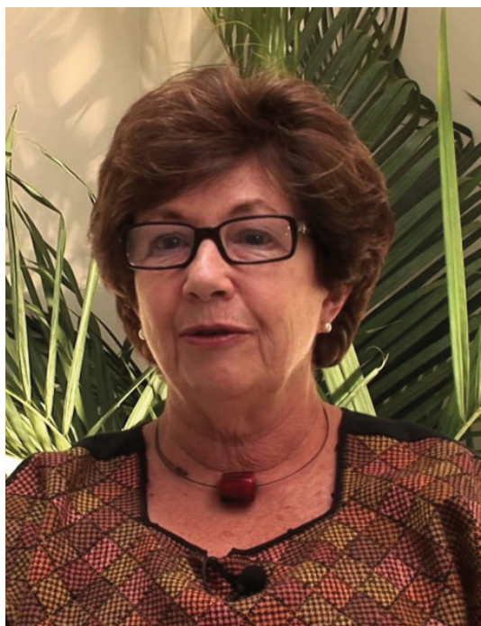
Figura 6. Dora Selma Fix Ventura.

2013: Dora Selma Fix Ventura (Brasil, nacida el 6 de noviembre de 1939). Psicóloga de la Universidad de San Pablo (1961), M. A. y PhD en Psicología Experimental de la Universidad de Columbia (Nueva York, Estados Unidos, 1964 y 1968). Su actividad docente e investigativa se ha llevado a cabo principalmente en el Departamento de Psicología Experimental de la Universidad de San Pablo, en el cual es Emérita en la actualidad. Sus intereses de investigación han sido la psicofísica de la visión, aplicada a la comprensión de las enfermedades neurodegenerativas del sistema visual de origen genético, metabólico o por exposición a agentes neurotóxicos (por ejemplo: Costa et al. , 2012). En 1998 recibió la Gran Cruz de la Orden Nacional del Mérito Científico del Ministerio de Ciencia y Tecnología de Brasil (Figura 6).