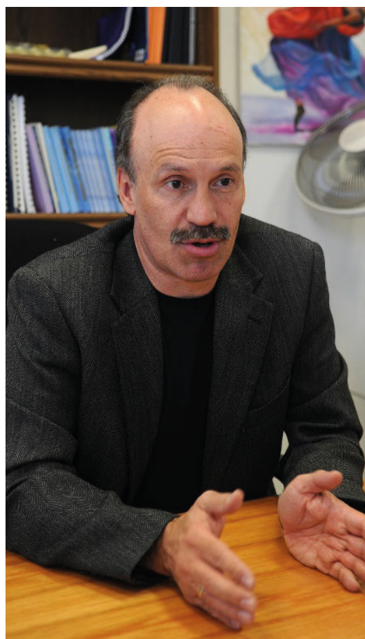
Figura 3. Rolando Díaz-Loving.

2007: Rolando Díaz-Loving (México, nacido el 5 de enero de 1954). B. A. en Psicología y PhD en Psicología Social, Universidad de Texas, Austin (Estados Unidos, 1977 y 1981). Su actividad docente e investigadora se ha efectuado principalmente en la Universidad Nacional Autónoma de México. Su pesquisa se ha concentrado en la conducta sexual y salud, la etnopsicología (cultura y personalidad), la psicología transcultural y las relaciones interpersonales y de pareja (por ejemplo: Negy, Snyder & Díaz-Loving, 2004). Fue distinguido con el Premio Interamericano de Psicología en 1997 (Figura 3).