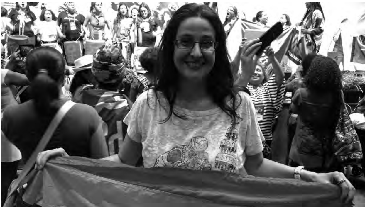
■ Momentos finales de la Conferencia Nacional de Políticas para las Mujeres, Brasilia, 2016

qualquer modelo ou abordagem construcionista da deficiência implica a escolha de perspectivas sociais da deficiência mais voltadas aos direitos humanos. E, inclusive, o modelo social veio também com uma proposta de alargar o conceito de deficiência quando estrategicamente disse que a velhice também pode ser considerada deficiência. Isso foi importante do ponto de vista da compreensão de que a deficiência passa a ser parte do ciclo de vida de todos nós. Entendo que apesar de sua “incompletude”, isso não quer dizer que o debate sobre o corpo deficiente deva ser desconsiderado em nossas análises. Para mim, embora as estruturas socioeconômicas e o ambiente sejam determinantes para a compreensão da experiência da deficiência, uma perspectiva que define a deficiência apenas em termos de barreiras não dá conta de explicá-la porque subestima a diversidade de experiências entre as pessoas com deficiência, que resulta de diferentes tipos de deficiência e de níveis de funcionalidade, bem como desconsidera que categorias como gênero, raça, orientação sexual, classe, idade, dentre outras, podem ser determinantes na análise social da deficiência. Eu sou mais afeita a pensar o alargamento da deficiência na lógica aleijada, ou da teoria crip, a fim de politizar o debate não só da deficiência, mas também das doenças crônicas e raras que também “deficientizam”. (Entrevista personal a Anahí Guedes de Mello)