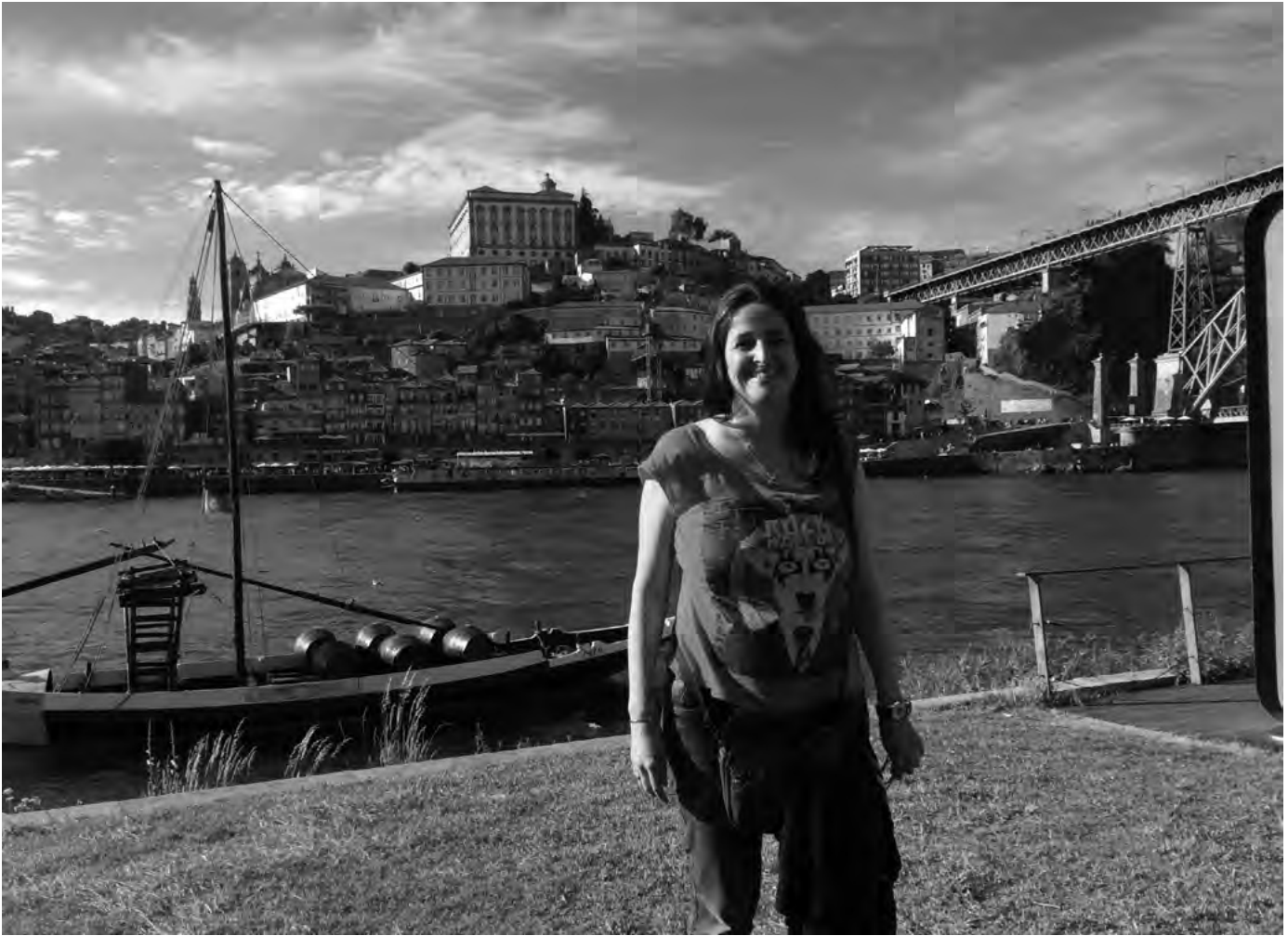
■ Rivera del río Duero, Oporto (Portugal), 2016

mulheres com deficiência sejam vistas também como violência de gênero. A terceira é explicar as violências contra mulheres com deficiência a partir da categoria cuidado, ou seja, o cuidado como marco teórico. Porque contrariamente ao apontado em publicações feministas sobre violência doméstica contra a mulher no âmbito conjugal, em que a dependência financeira e emocional são os principais motivos pelos quais as mulheres desistiam de denunciar seus agressores, a maioria homens, nas violências contra mulheres com deficiência esses motivos ficam em segundo plano, não que não sejam importantes, mas são questões secundárias porque a primeira preocupação das mulheres com deficiência é “Quem vai cuidar de mim?”. Essa “rede de cuidados” geralmente inclui pessoas de sua rede de parentesco além dos próprios cônjuges, majoritariamente mães, pais, irmãs, irmãs, filhos e filhas que, em maior ou menor grau, cuidam ou deveriam cuidar de sua/seu filha/filho, irmã/irmão e mãe/pai com deficiência. Também pode envolver a