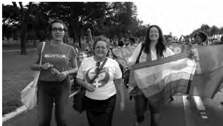
▪ En la Marcha de Mujeres, Conferencia Nacional de Políticas para Mujeres, Brasilia, 2016

O modelo social da deficiência como hegemonicamente o concebemos foi proposto por ativistas homens com lesão medular britânicos com o objetivo de separar a “deficiência” da “doença”, um gesto que serviu para politizar o debate da deficiência para o patamar dos direitos humanos. Assim, no momento em que promoveu uma guinada na compreensão do que seja deficiência, quando esta passa a ser centrada nas barreiras da estrutura social e não mais no corpo do indivíduo, isso permitiu elevar as pessoas com deficiência ao status de sujeitos de direitos humanos. Nesse sentido, o modelo social é um marco histórico fundante e fundamental para a compreensão do que seja deficiência, em que o contexto sociocultural passa a ser o elemento constitutivo da deficiência. A opção metodológica por