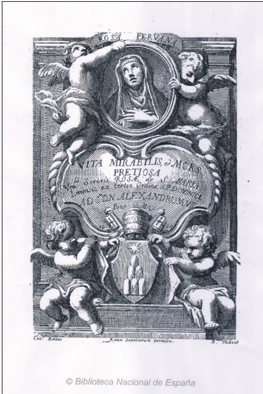
Imagen de Santa Rosa en Astro Brillante