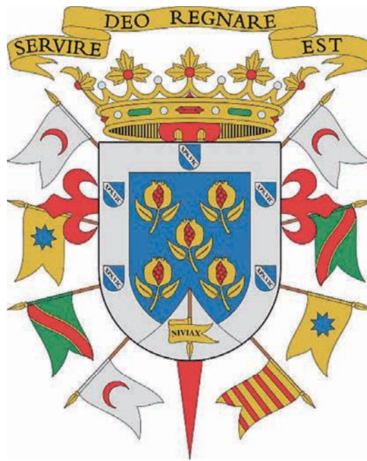
Escudo de Campotéjar (Granada)

proyectado esta unión, para ennoblecerla 17 , cuando la verdad es que ambas ramas, la monegasca y la de los marqueses de Campotéjar, aunque tienen un origen común, apenas tuvieron relación entre sí porque los troncos familiares se separaron a mediados del siglo XIII 18 .