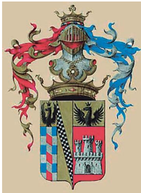
Escudo de los Cattaneo Adorno Giustinani

anterior de Durazzo, dando a entender la creación de una nueva línea en su cabeza, como heredero de las familias Durazo y Pallavicini. Fue una acción realizada poco antes de su nuevo matrimonio y seguramente pensando en sus posibles herederos. Se trataría de una nueva dinastía desprendida del gran tronco de los Durazzo y que unía la herencia de los Pallavicini, incluyendo la herencia española, el marquesado de Campotéjar, y todas sus posesiones granadinas.