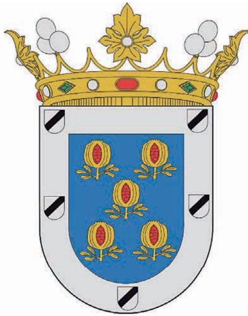
Escudo de Jayena (Granada)