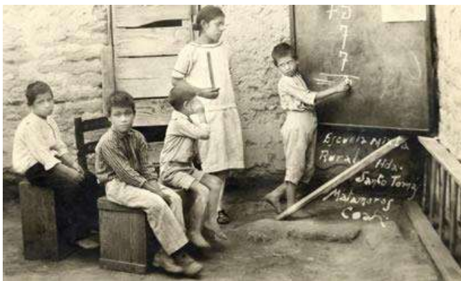
Escuelas rurales, objetivo de los pedagogos krausistas americanos