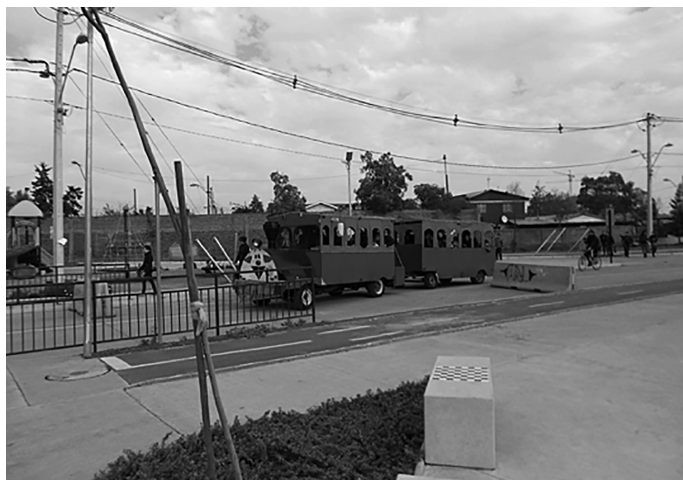
Figura 3. Día del Patrimonio en la población La Legua, 2016.

población que ha sido retratada como «crítica». Quizá el ejemplo concreto más llamativo es el medio de transporte elegido para movilizar a los visitantes, un tren (Figuras 3 y 4) que permite observar la población desde sus ventanas como lo haría un viajero.