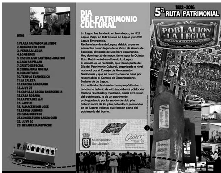
Figura 6. Tríptico Día del Patrimonio en la población La Legua, 2016.