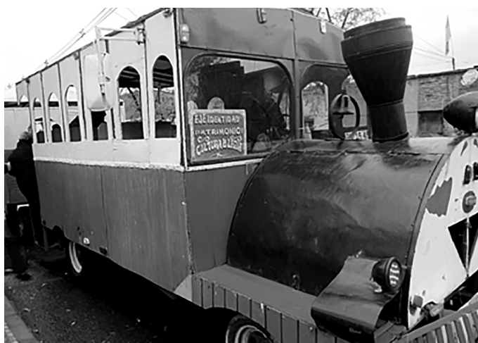
Figura 4. Día del Patrimonio en la población La Legua, 2016.