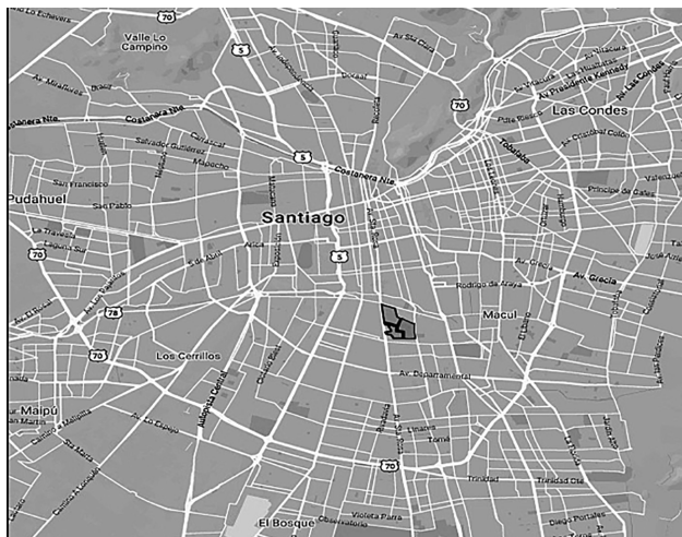
Figura 1. Mapa de la población La Legua en el contexto de Santiago.