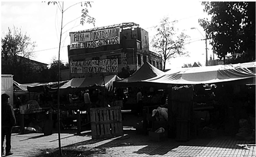
Figura 5. Día del Patrimonio en la población La Legua, 2017.

Todos los actores descritos son parte del trayecto de la Ruta, pero también es importante mencionar a un tipo de actor implícito. Se trata de las organizaciones y/o colectivos del territorio autónomos (Santamarina y Mompó, 2018), los que a través de grafitis o pancartas en la vía pública muestran su rechazo a la organización de la Ruta, denunciándola por exotizar a la población, instrumentalizar la fecha para obtener recursos del Estado y abusar de la noción de patrimonio. Por ejemplo, para la Ruta Patrimonial del año 2017, una de las organizaciones colgó un lienzo en el frontis de su sede que decía « Fuera los turistas de La Legua, por los muertos y silenciados. Por los allanados, por los intervenidos. Fin a la intervención del Estado » (Figura 5).