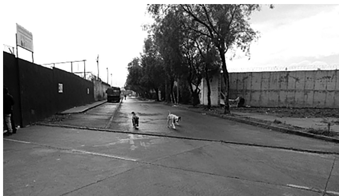
Figura 8. Día del Patrimonio en la población La Legua, 2017. Fuente: elaboración propia.

Cuando el tren pasa por Legua Emergencia, una de las observadoras reflexiona: «Me llamó la atención el ambiente de tensión que se generó en el recorrido a la hora de pasar por Legua Emergencia [...] logré observar cuando una de las señoras organizadoras les decía a algunas personas que estaban tomando fotos que no lo hicieran donde estaban algunos hombres en estado de ebriedad o drogados» (notas de campo, observador 4, mayo de 2016).