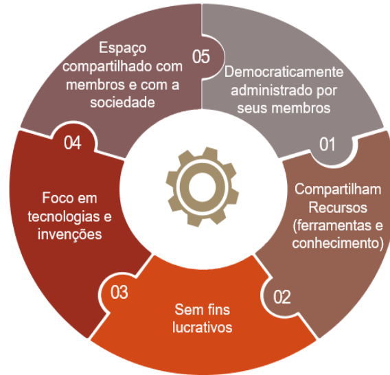
Figura 1 – Pontos característicos de um hackerspace