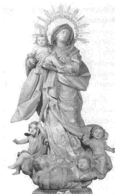
Figura 3: Virgen de la Antigua , José Luján Pérez. Catedral de Santa Ana (Las Palmas de Gran Canaria, 1811).

En cuanto a la escultura llegada a la Catedral de Las Palmas, procedente de Flandes en el decurso del Quinientos, la misma fue sustituida en el siglo XVII por una talla sevillana de candelero y madera policromada, hasta que, en 1811, el insigne imaginero canario José Luján Pérez (1756-1816) ejecuta la obra que actualmente recibe culto, la cual alcanza una altura cercana a los dos metros ( Fig.3 ).