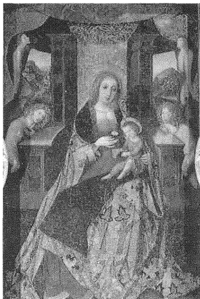
Figura 2: Virgen de la Rosa , Alejo Fernández. Iglesia de Santa Ana, Triana (Sevilla, S. XVI).

No hemos de olvidar que desde el momento en que se iniciaron los trabajos de construcción de la Catedral canariense, a cargo del arquitecto portugués Diego Alonso de Montaude, se tomó como modelo a imitar la Catedral sevillana, “de quien es ésta sufragánea” 29 , y desde Sevilla arribaron al archipiélago los primeros canónigos y beneficiados que habrían de ocupar las sillas del nuevo Cabildo Catedralicio 30 , al igual que lo hizo la advocación mariana