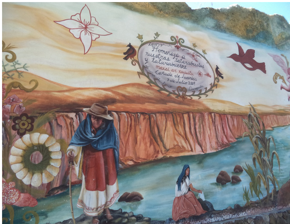
Imagen 8. Detalle del mural, la ancianidad mítica, el día, el agua y el maíz

Pero a diferencia del diseño, a la izquierda del mural aparece una mujer lavando ropa en el río que baja por la Cañada de Juanica desde el Pinal del Zamorano alimentando algunas plantas de maíz, cuyo fruto destaca en el extremo opuesto: de la vegetación natural al cultivo de un erial (ver imagen 8).