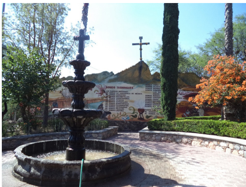
Imagen 3. Vista del mural en el jardín Padre Fide

Una muestra del activismo de última hora del profesor fue la promoción de todo el complejo que representa el jardín de Juanica, incluyendo su mural. De hecho, el diseño original del mismo se le debe a él, tal como lo consignó la antropóloga Mirtha Leonela Urbina (ver imagen 4). Esta autora ubica la expresión plástica como un elemento asociado a la influencia y capacidad de intermediación que este profesor tuvo hasta su deceso. Es decir, la identifica con intereses políticos estrictamente personales, pues, el mismo profesor registró en 2009 los derechos del diseño “con carácter de autor individual y privado” en contraste, señala la antropóloga, con el “[...] carácter oral, anónimo y colectivo de la cultura popular otomí” (Urbina, 2016: 425).