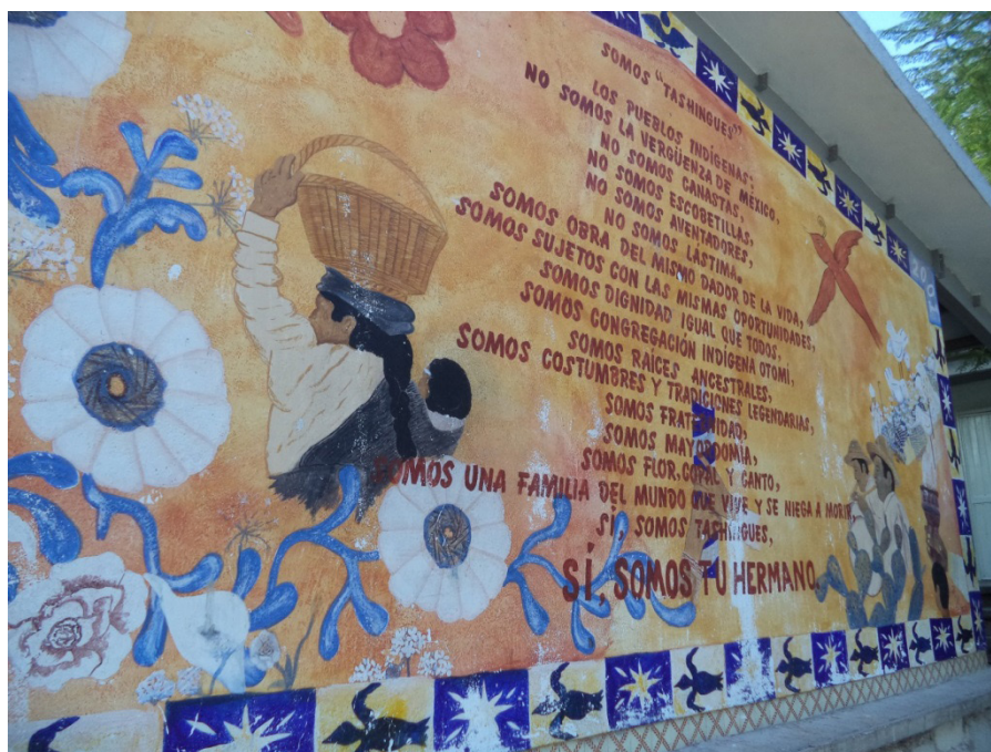
Imagen 5. Mural en la escuela Miguel Hidalgo, Cieneguilla, municipio de Tierra Blanca, Guanajuato