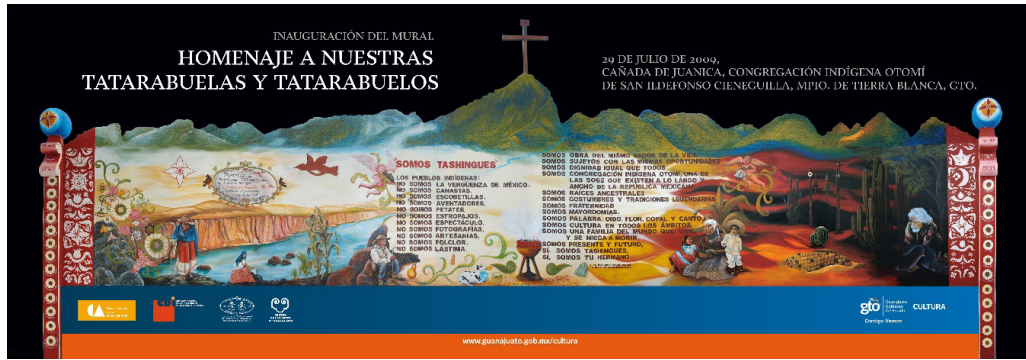
Imagen 1. El mural reproducido en un volante que invita a su inauguración.

Lo anterior dista de ser irrelevante porque una gama de desempeños públicos y cívicos se sitúan bajo la presencia de elementos míticos reproducidos y fijados en una representación plástica que refiere al principio local el cual busca equiparar la ancianidad con la guía moral. Además, como parte del complejo en el que se inserta el mural hay también un “calvario”; este reproduce a los nichos que antiguamente eran ubicados en parcelas familiares como resguardos de las “cruces de difuntos”, pequeños maderos decorados que representaban individualmente a miembros fallecidos del propio linaje. En su momento en este recinto fueron colocadas tres cruces que aludían a integrantes de la familia más relevante de Juanica desde la segunda mitad del siglo XX: los Ramírez Moreno (ver imagen 2). Los fallecidos habían tenido desempeños rituales destacados, sobre todo, habían ocupado cargos centrales en los tres niveles políticos locales: representantes comunitarios, delegados de la congregación y presidentes municipales.