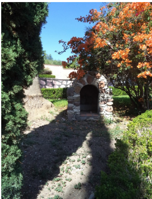
Imagen 2. Calvario instalado en el jardín Padre Fide (Fotografía del autor, 2019)