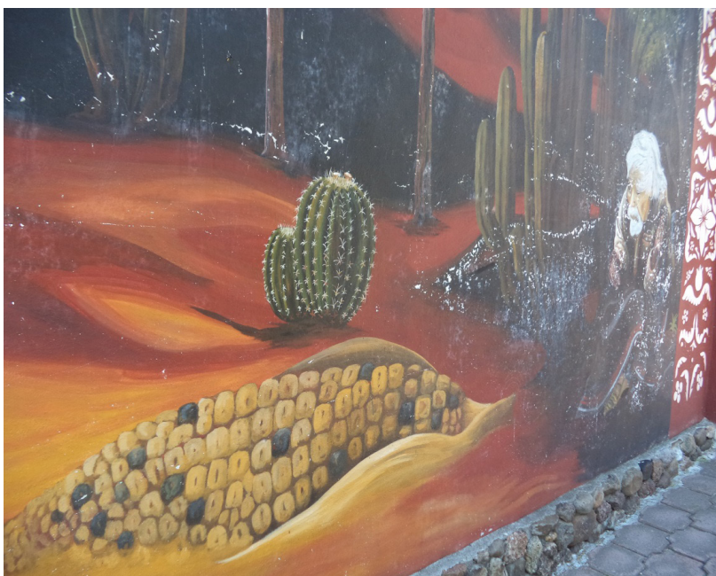
Imagen 7. Detalle del mural, la ancianidad mítica, la mazorca y la noche

A los extremos del mural, y haciendo un contraste de género con los dos personajes mencionados anteriormente, fueron colocados los ancianos que mitológicamente remiten al padre viejo y a la madre vieja, y a la sociabilidad otomí aludiendo de paso al día y a la noche (Galinier, 1990). Cabe señalar que los individuos que representan estos arquetipos tenían en vida atribuciones asociadas con ciertas capacidades de nagualismo (don Isaac) (ver imagen 7) y brujería (doña Porfiria).