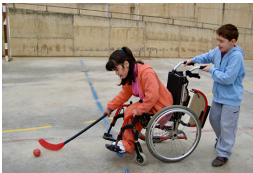
Figura 2. Sesión de Hockey, Educación Física Adaptada (Alumno: recurso humano) Escuela Benviure. Sant Boi de Llobregat (Barcelona)