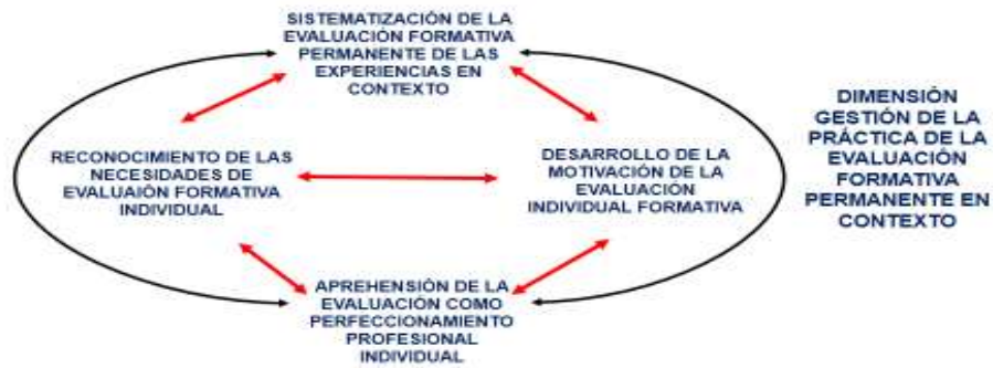
Figura 1. Gestión de la práctica de la evaluación formativa en contexto.

Por su complejidad la sistematización de evaluación formativa de las experiencias profesionales en contexto es el cimiento teórico – práctico para gestar una nueva relación dialéctica, dando cuenta de la segunda dimensión, que es la dimensión cultura de perfeccionamiento profesional contextualizado. Se concreta en el empoderamiento de la evaluación formativa experiencial contextual , el empoderamiento definido como el desarrollo del sentido de pertenencia en cuanto a la estructura del proceso de la evaluación formativa contextual en relación con el contenido de la evaluación formativa contextualizada, visto como el pretexto para el perfeccionamiento profesional en los contextos en donde se desempeñan los docentes de Educación Superior. El sentido de pertenencia al proceso evaluativo, va generando acciones metodológicas participativas que conducen a proponer nuevos diseños, desde la planificación y ejecución, de la estructura de procesos de la evaluación formativa contextual en relación con el contenido de la evaluación formativa contextualizada.