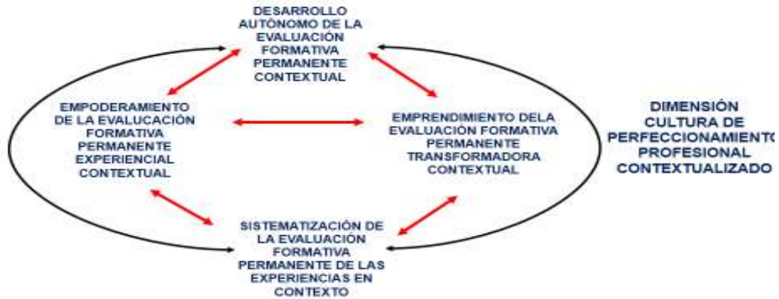
Figura 2. Cultura de perfeccionamiento profesional contextualizado.

En estrecha relación con lo desarrollado en el presente epígrafe el modelo de gestión del proceso de la evaluación formativa contextualizada se expresa en su integralidad de la siguiente manera: