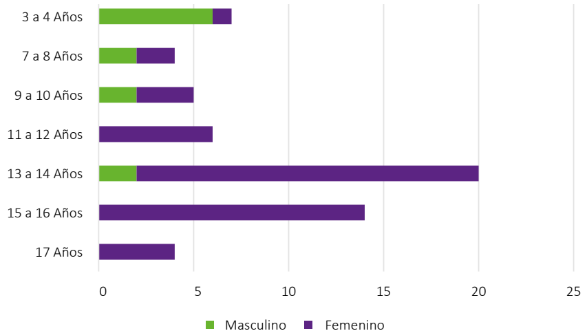
Figura 1. Casos de patología tiroidea en pacientes menores de 18 años. Instituto Nacional de Salud del Niño - Sede Breña, 2008-2017.

Se realizaron 60 intervenciones quirúrgicas para patologías correspondientes a la glándula tiroidea, en donde al sexo femenino correspondió al 80% de los casos (48 pacientes) y el 20% al sexo masculino (12 pacientes). Con un promedio de edad de 12,2 años y un rango de 3 a 17 años para la población en estudio; además, la mayor cantidad de casos se presentó entre 13 a 16 años con 34 casos los cuales corresponden al 56,6%. En el sexo masculino la mitad de los casos se presentó entre 3 y 4 años de edad y después se distribuye entre 7 a 10 años; mientras que para el sexo femenino el predominio fue entre 13 a 16 años (Figura 1).