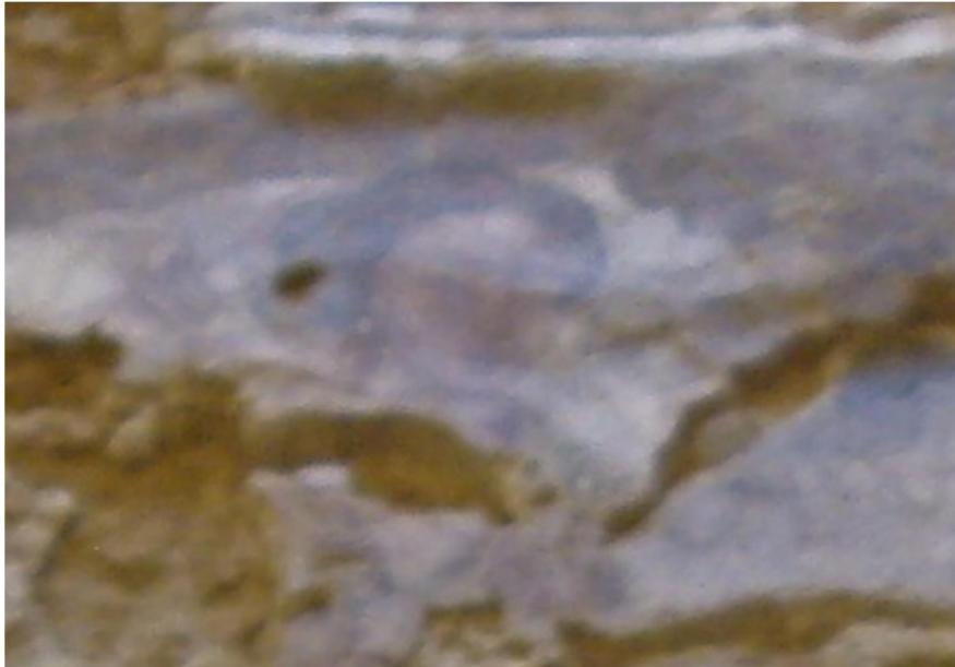
Mosaico femenino fragmentado en la villa roma de Camarzana de Tera.

En esta fotografía 57 se observa el mosaico tal cual lo admira un visitante, a distancia y con escasa nitidez, pero aún hermoso y sugerente.