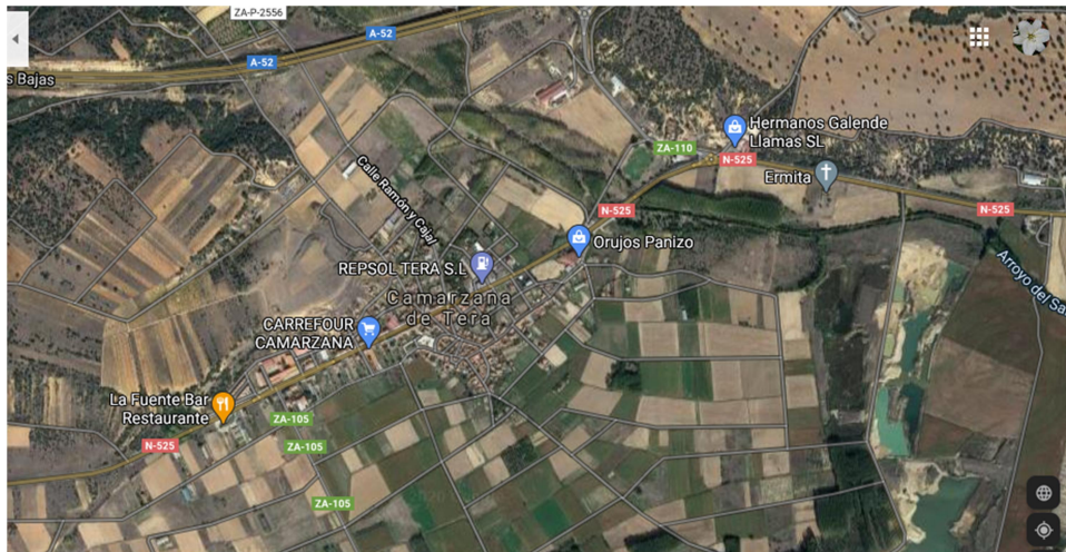
Ortofotografía tomada de google maps. Última visita a la página 17/10/2020. https://www.google.es/maps/@41.9947367,-6.0321746,2068m/data=!3m1!1e3

La zona 5 estuvo ocupada y poblada desde la Primera y Segunda Edad de Hierro 6 y atesora también un castro prehistórico.