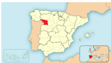
Provincia de Zamora

La localidad de Camarzana de Tera, situada a la vera del río Tera, en la provincia de Zamora (comunidad autónoma de Castilla y León), limita al norte con León, al oeste con Portugal, al este con Valladolid y al sur con Salamanca.