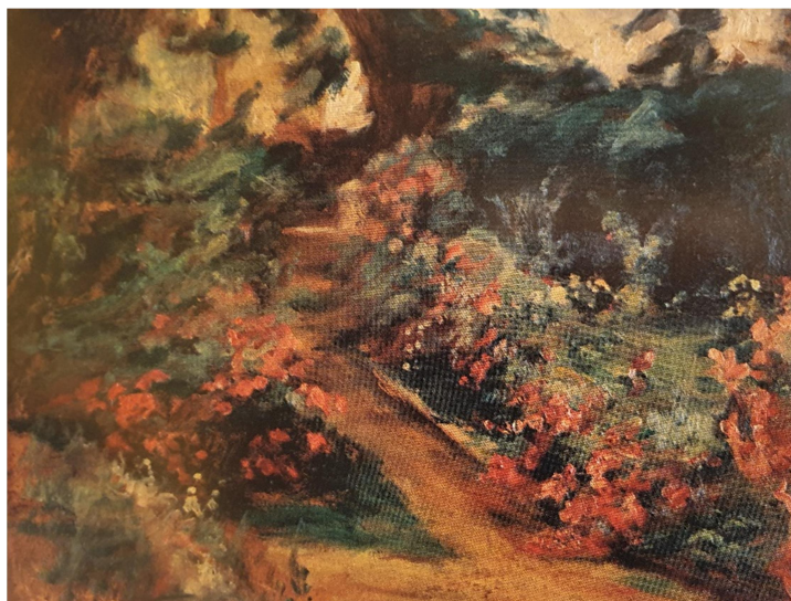
Paisaje. Colección privada.