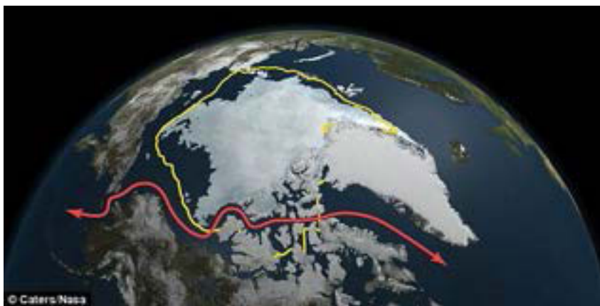
Figura 2. Fotografía satelital donde se muestran las dos nuevas rutas marítimas costeando Groenlandia.

No cabe duda alguna de que el transporte marítimo siempre ha sido el medio natural de comercio internacional y para ello ha utilizado las clásicas rutas marítimas. Estas casi siempre han estado bastante saturadas, especialmente en los cuellos de botella geográficos denominados choke point 5 . Pero si cabe, esta saturación se ha visto incrementada en los últimos años debido a la incorporación casi de forma masiva de los cruceros de recreo, el aumento de las flotas pesqueras o la implantación de las autopistas del mar, sin olvidar el aminoramiento de costes debido a la mejor gestión de los puertos y muchos otros factores. Pero también los riesgos y amenazas a la navegación se están incrementando; piratería, terrorismo marítimo, rapto de buques, amenaza de cierre de estrechos, etc. Por ello, el deshielo del Ártico y sus dos rutas marítimas se empiezan a vislumbrar como un esperanzador futuro, debido a poder disponer de unas derrotas más rentables y seguras, esto influiría de forma decisiva a Groenlandia debido a que cada una de estas dos rutas marítimas pasarían por ambos lados de la isla.