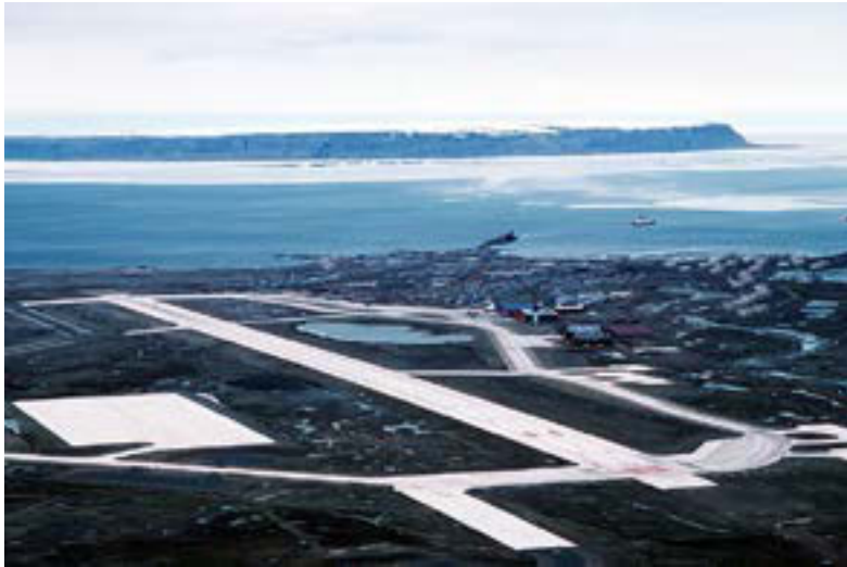
Figura 7. Vista aérea del aeropuerto de Pituffik en la base militar de Thule.

Thule también alberga al Tercer Destacamento del 22 Escuadrón de Operaciones Espaciales, parte del 50th Space Wing 28 , una red global de control de satélites y muchos nuevos sistemas de armas. Además, el moderno aeródromo ostenta una excelente pista de aterrizaje de 10.000 pies (3.000 metros) desde la que se efectúan 2.600 vuelos anuales hacia los EE. UU y a otros países del mundo.