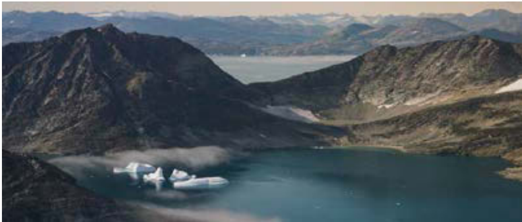
Figura 3. Groenlandia fotografiada por un equipo científico de la NASA en su misión para estudiar el derretimiento de los icebergs. Disponible en https://elpais.com/internacional/2020-04-24/groenlandia-y-ee-uu-sellan

Su desaparición podría destruir las infraestructuras existentes, como los cimientos de las casas, tuberías, alcantarillados, carreteras o líneas de ferrocarriles. Según los expertos, se considera que para el año 2050 aproximadamente el 20 % de todas las instalaciones e infraestructuras industriales y aproximadamente el 45 % de las viviendas familiares que actualmente se encuentran en la zona cubierta por el permafrost podrían sufrir unos enormes daños, valorados en unos 100.000 millones de dólares.