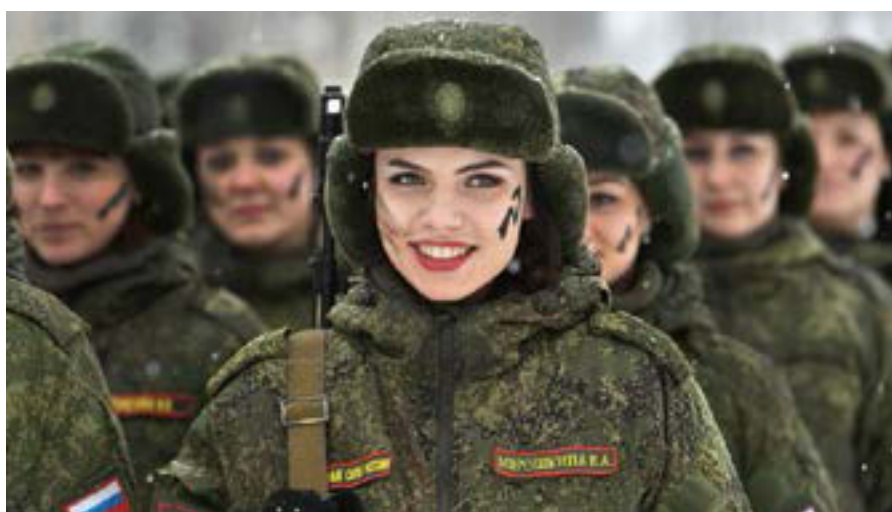
Figura 5. Miembros de las Tropas de Misiles de Designación Estratégica de Rusia.

revolución y también en diversos ámbitos, entre los que cabe destacar los siguientes: se están abriendo nuevas bases, se están construyendo rompehielos de combate, reformando submarinos, se han instalado radares y modernos sistemas de mando y control. También se están desplegando más tropas en la región que están realizando maniobras militares con tropas de elite en zonas extremadamente frías y nunca experimentadas anteriormente. Otro factor que puede llegar a ser preocupante radica en que dos tercios de la Armada rusa tienen sus bases navales en el Ártico.