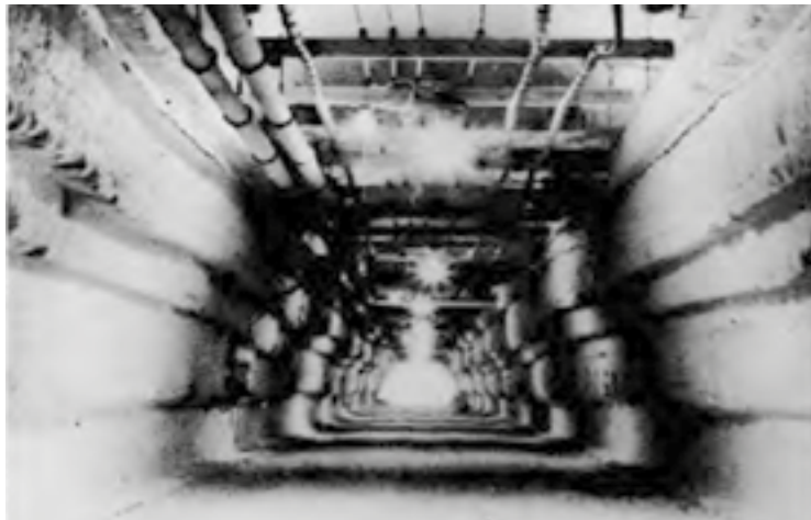
Figura 6. Trinchera principal de comunicaciones de la base Camp Century, Groenlandia, Dinamarca dtic.mil. Fuente: https://actualidad.rt.com/actualidad/216793-base-militar-secreta-eeuu

Durante la Segunda Guerra Mundial, las Fuerzas Armadas norteamericanas construyeron un auténtico búnker militar de grandes dimensiones totalmente secreto en la zona geográfica del noroeste de la isla. Este gran complejo militar, que era conocido como Camp Century estaba operado por unos 200 militares. Este recinto estaba diseñado a base de un complejo sistema de túneles de tres kilómetros en el cual se podían encontrar todos los servicios fundamentales como hospitales, laboratorios, talleres de mantenimiento, comedores, bares, restaurantes, también lugares de ocio como cines o teatros, tiendas o incluso una iglesia para celebrar los servicios religiosos, y dada la extensión del recinto, también contaba con un ferrocarril bajo la nieve.