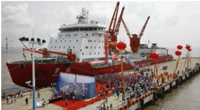
Figura 3. El primer barco de investigación polar y rompehielos de fabricación nacional china, Xuelong 2.

En términos de inversión, ni los estadounidenses ni los daneses han invertido mucho en Groenlandia a lo largo de los años. Por ejemplo, Nuuk, que es la capital y donde está establecida la mayor parte de sus habitantes de raza inuit, aproximadamente un 88 % tienen la sensación de ser relativamente pobres.