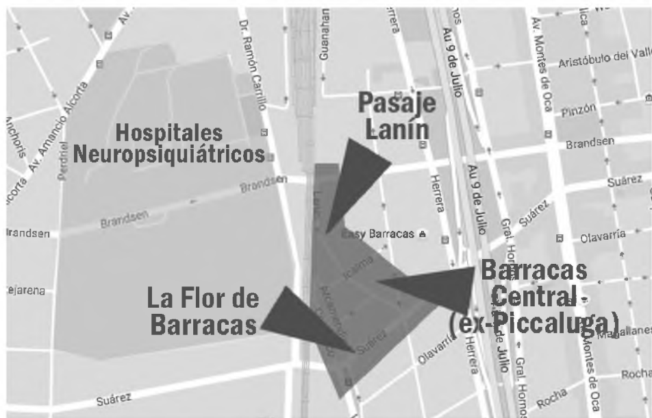
Figura 3. Detalle de la ubicación del Pasaje Lanín y de La Flor de Barracas. Elaboración propia