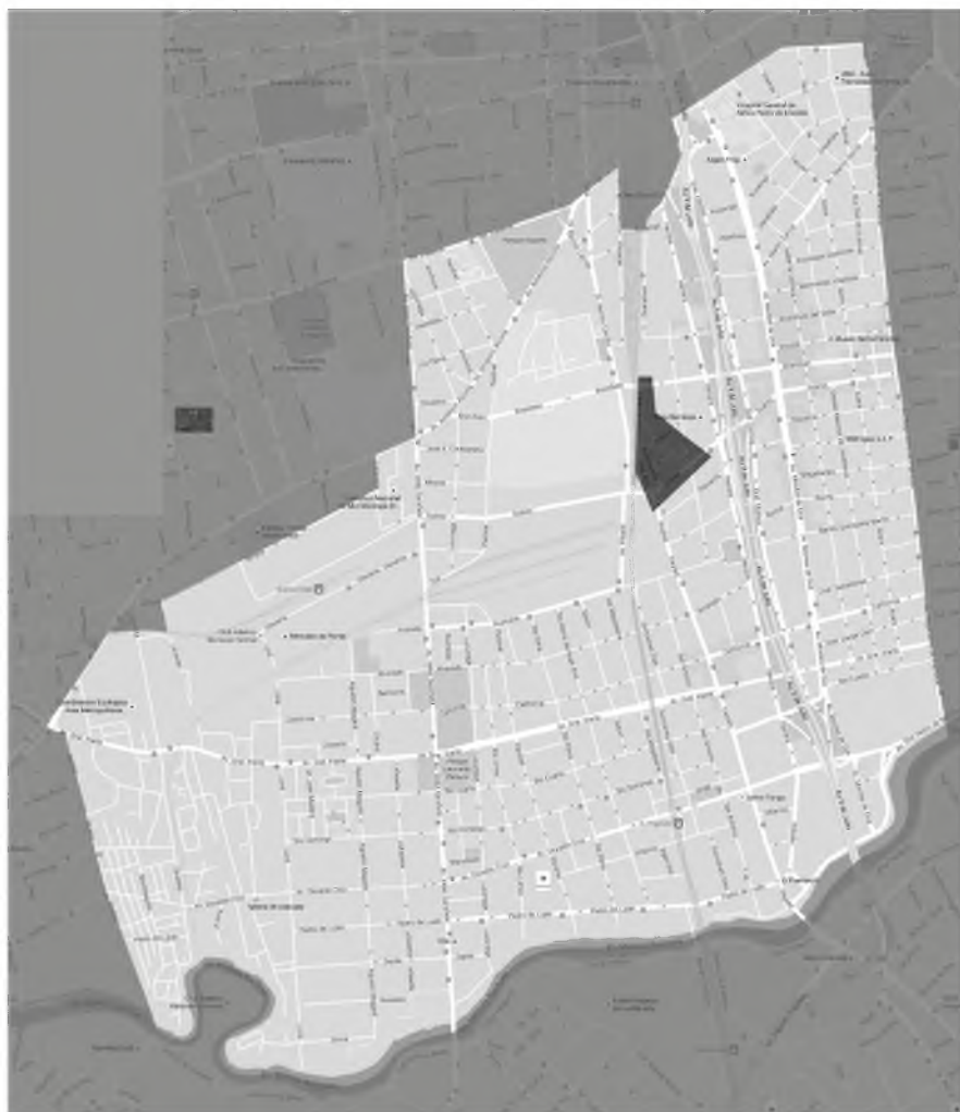
Figura 2. Área del Pasaje Lanín y La Flor de Barracas en el plano de Barracas. Elaboración propia