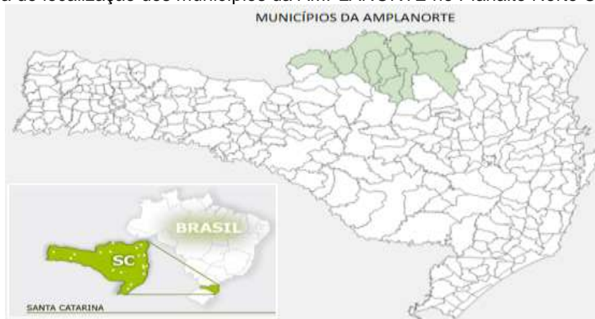
Figura 2 - Mapa de localização dos municípios da AMPLANORTE no Planalto Norte Catarinense