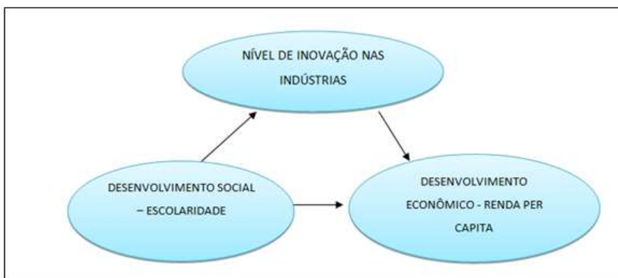
Figura 1- Modelo Estrutural

Os autores Cassol, Artifon e Perozin (2016), evidenciaram em seus estudos que o capital intelectual influencia positivamente a inovação. Na pesquisa considerou-se o capital intelectual formado pelo capital humano, estrutural e relacional e por análise dos dados obtidos de equações estruturais num grupo de 88 empresas incubadas, concluíram que o capital intelectual é um recurso estratégico para a inovação das empresas incubadas de Santa Catarina.