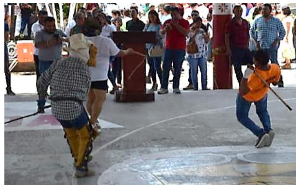
Fig. 8.- Toreada Sagrada en Tanlajás. Abril 2019

Algunos lo toman como penitencia, para otros, tal acto es una lucha entre el bien y el mal, tradición que, según algunos reportes, tiene un centenar de años, y que tanto pobladores locales como promotores culturales tratan de difundirla para que pueda considerarse patrimonio cultural de Sn Luis Potosí. (López, 2018)