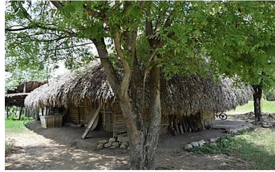
Fig. 7.- Fachada de vivienda en la comunidad de San Isidro. Municipio de Tanlajás. Fuente: Carlos Pedraza. Julio 2019