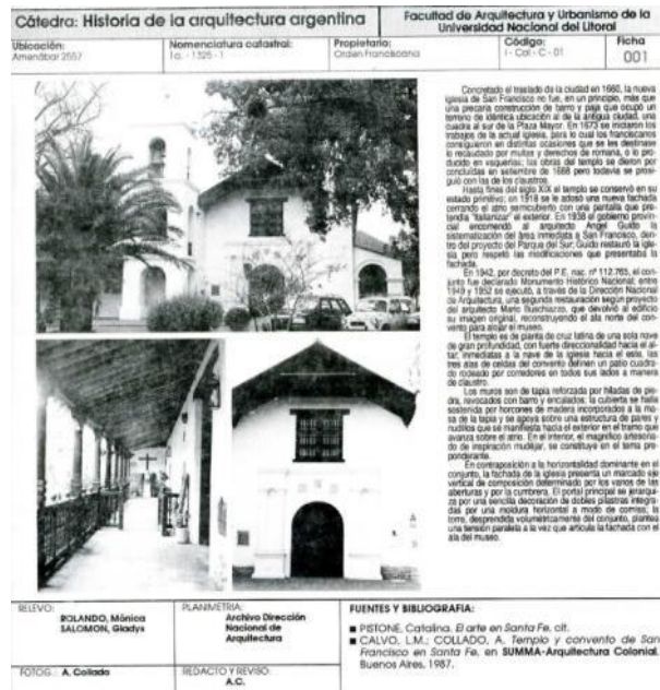
Fig. 1.- Ejemplo de ficha de catalogación del patrimonio. (González Licón & Hiriart Pardo, 2010)

Estado de conservación. Este punto servirá para conocer a grandes rasgos, el estado que guardan cada uno de los elementos constructivos de los inmuebles, al momento de realizar su catalogación. Se consigna como Bueno, Regular o Malo.