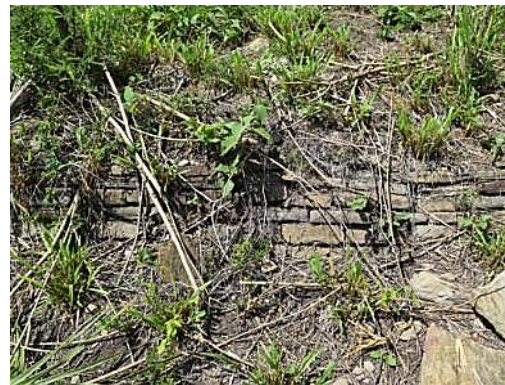
Fig. 5.-Detalle del asentamiento. Fuente: Carlos Pedraza. Julio 2019

Respecto de la arquitectura religiosa (origen virreinal y/o posterior) señalado en la metodología, existe el templo católico edificado en honor a Santa Anna, (Fig. 6) algunos autores aluden a que fue la primera iglesia construida en la huasteca pero ello es altamente improbable, sin embargo si es de las primeras construcciones en la región, hecha originalmente de piedra, arcilla y palma y destruida por un incendio, fue posteriormente reconstruida con mamposteo dejando el campanario notablemente separado del cuerpo del templo, ello entre 1758 y 1765 (Gobierno de San Luis Potosí, 2016, pág. 25).