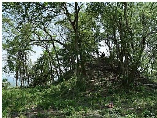
Fig. 4.- Vestigios arqueológicos entre las comunidades de La Concepción, San Isidro y Malilija.