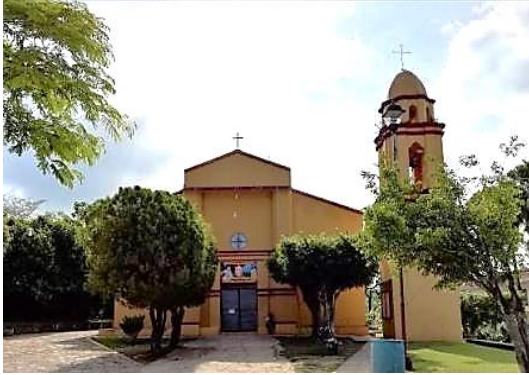
Fig. 6.- Fachada del templo de Santa Anna, Tanlajás. Fuente: Carlos Pedraza Gómez, junio 2018