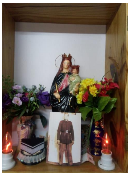
Fig. 5. Virgen María en la Comisaría Enrique Grippo.

Se pueden encontrar otras manifestaciones culturales de la religión católica en la localidad, en diferentes espacios públicos. En la Municipalidad, en el patio interno del edificio, la imagen del Sagrado Corazón de Jesús. La misma se instaló en ese lugar en el año 1997, en el actual edificio del Municipio. En la Comisaría Cabo Enrique Grippo está presente una imagen de la Virgen María desde el año 2007, momento en el que se amplió la comisaría (Fig. 5). En el edificio de la Aduana (Paso Fronterizo Río Jeinemeni) es visible una imagen del patrono de la localidad, el Sagrado Corazón de Jesús desde el año 2015. Esta misma imagen está en la estación de Bomberos desde el año 2011, también se instaló un crucifijo en la entrada del cuartel y algunos cuadros religiosos en la sala de espera desde 2007, que es cuando se inauguró y puso en funcionamiento el edificio. El Hospital Seccional Dr. Reynaldo A. Bimbi posee la imagen del Sagrado Corazón de Jesús. Aunque no es común encontrar imágenes religiosas en los establecimientos educativos provinciales, en la Escuela Primaria Provincial N° 17 Policía Federal Argentina se encuentra la imagen de la Virgen de Luján en la Dirección; de esta se desconoce el origen y el año en que se instaló. En el mismo establecimiento educativo, además, existe un cuadro y un crucifijo en la Secretaría en la misma situación, desconocimiento del origen y año.