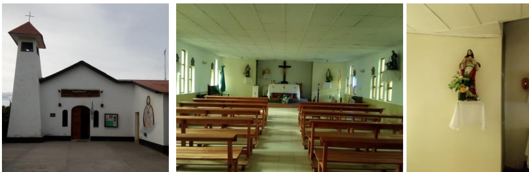
Fig. 2. Parroquia Sagrado Corazón de Jesús. Fig. 3. Interior de la parroquia. Fig. 4. Imagen del Sagrado Corazón de Jesús.

La parroquia Sagrado Corazón de Jesús, se ubica en la calle Cruz del Sur, el fondo del patio en el que se encuentra el templo limita con la calle Patagonia Argentina. Corresponde este sector al casco antiguo de la localidad. La parroquia está rodeada por la primera escuela primaria (EPPN° 17 “Policía Federal Argentina”, del año 1932), la Plaza Principal “San Martín” y el hospital local (construcción del año 1992).