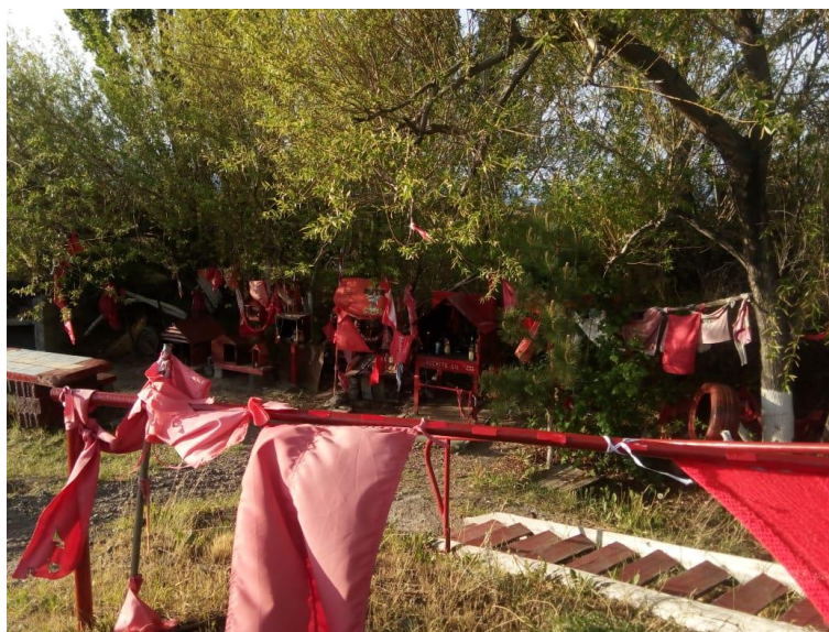
Fig. 6. Gauchito Gil sobre RP 43.

La imagen del Gauchito Gil, es una de las que más se repite sobre la RP 43 (Fig. 6) y en Los Antiguos. El santuario más grande se ubica a 40 km sobre la RP 43 en dirección hacia Perito Moreno. Otro santuario está presente sobre la misma ruta a unos 10 kilómetros y un tercer lugar de veneración de la imagen, dentro de la localidad.