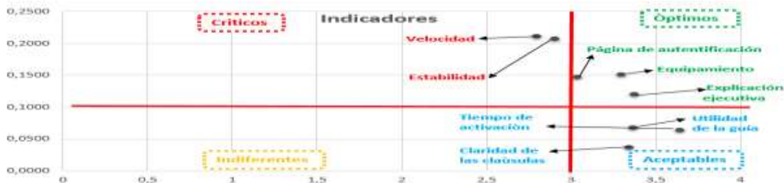
Figura 2. Matriz de atributos