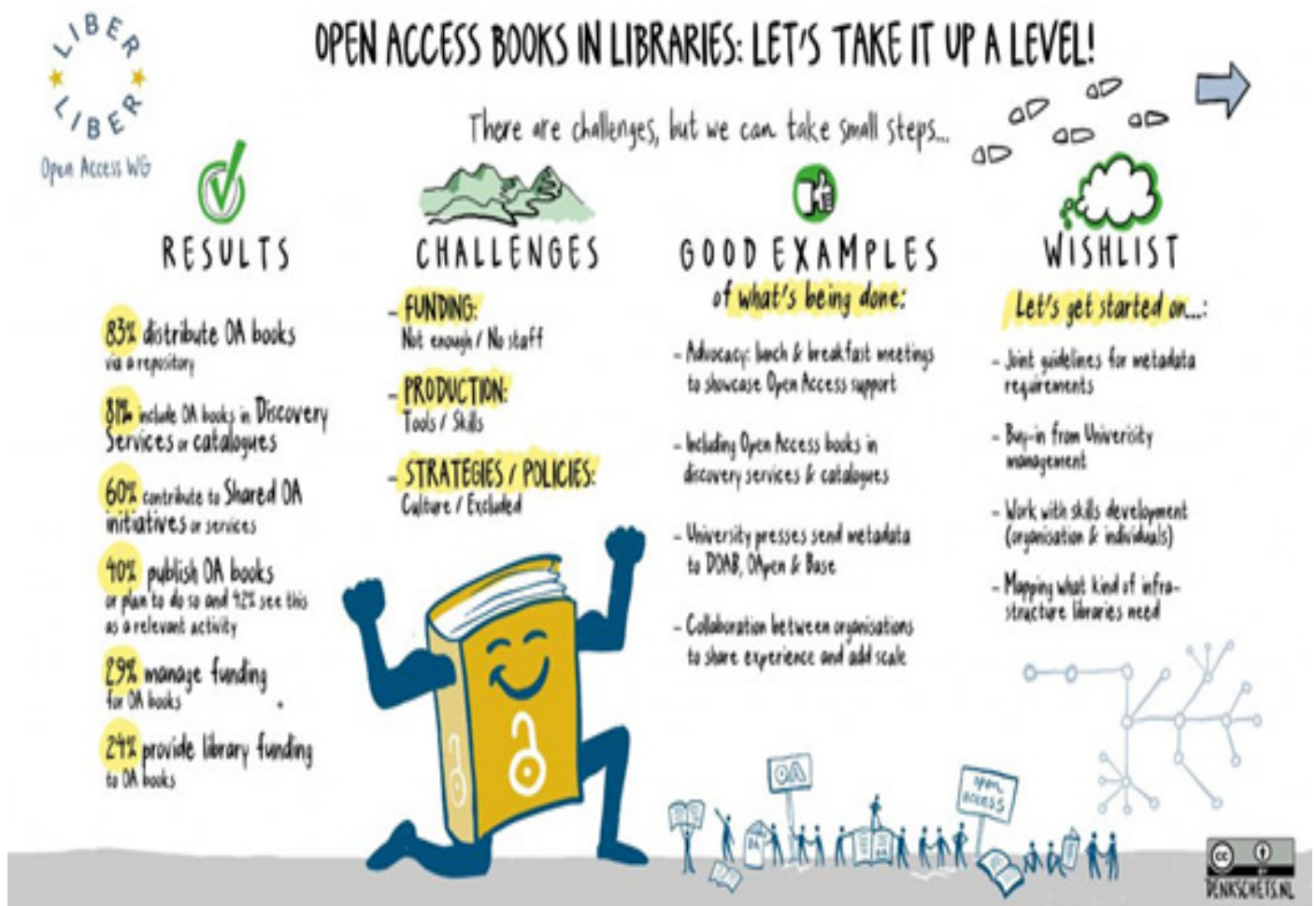
Fig. 1. LIBER Infografía sobre libros en OA

miento y la interoperabilidad entre los sistemas, y también considera que las comunidades deben apoyar la bibliodiversidad y permitir múltiples formatos y otras innovaciones en la publicación en las que las bibliotecas tienen un papel clave en la transición hacia el libro de acceso en el contexto académico. De la misma manera, Olaf Siebert en Ways for Libraries to Support OA Books considera también que las bibliotecas tienen un papel clave en la transición hacia el OA de los libros (Siebert, Olaf, 2019) presentando un panorama general de tres esferas relacionadas con las estructuras o los flujos de trabajo comunes de las bibliotecas.