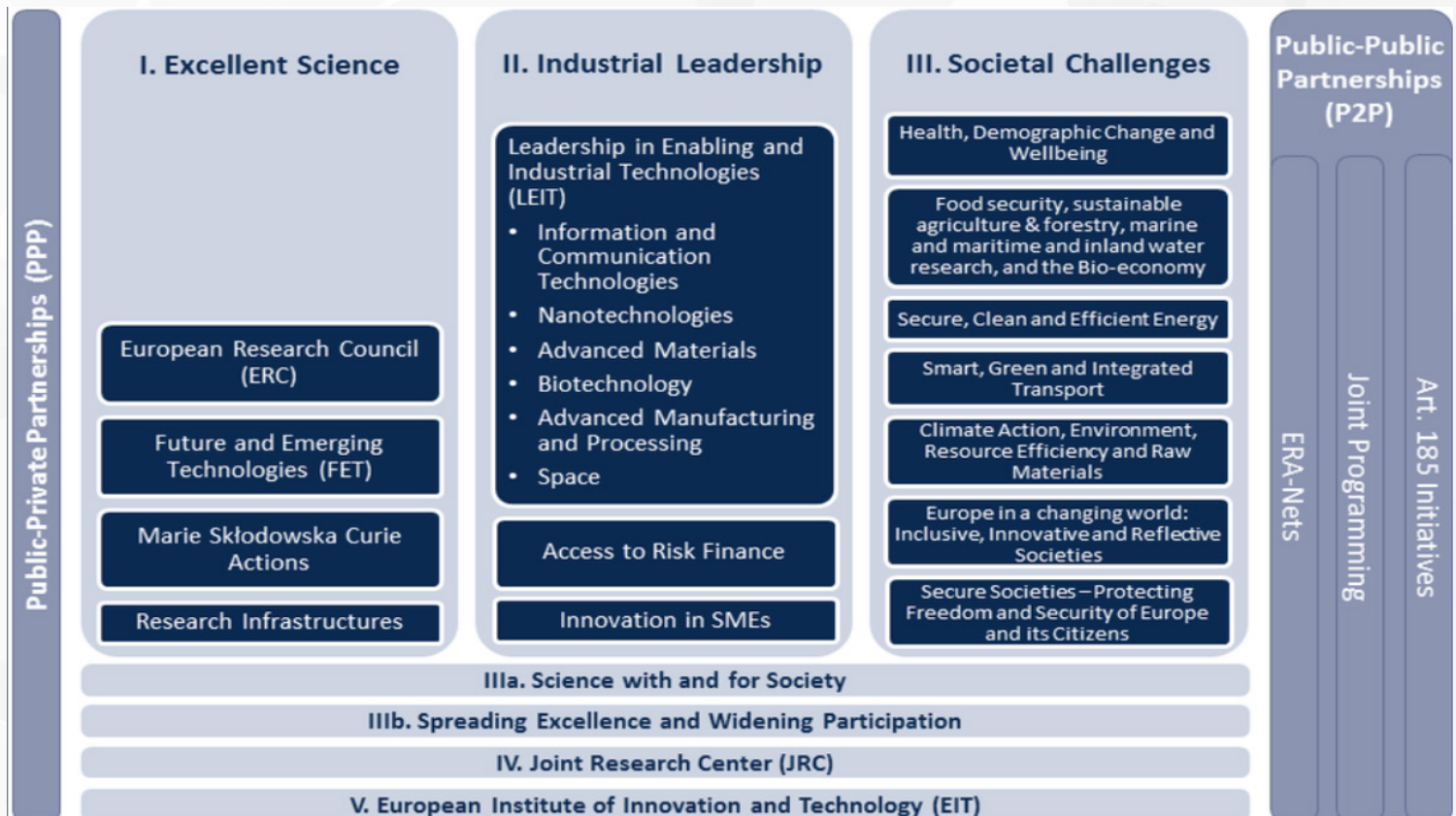
Tabla 2. Programa Marco Horizonte 2020 (2014-2020): Los tres pilares (ciencia excelente, liderazgo industrial y retos sociales) y sus programas de trabajo

Fuente: Comisión Europea y Technische Universität Dresden