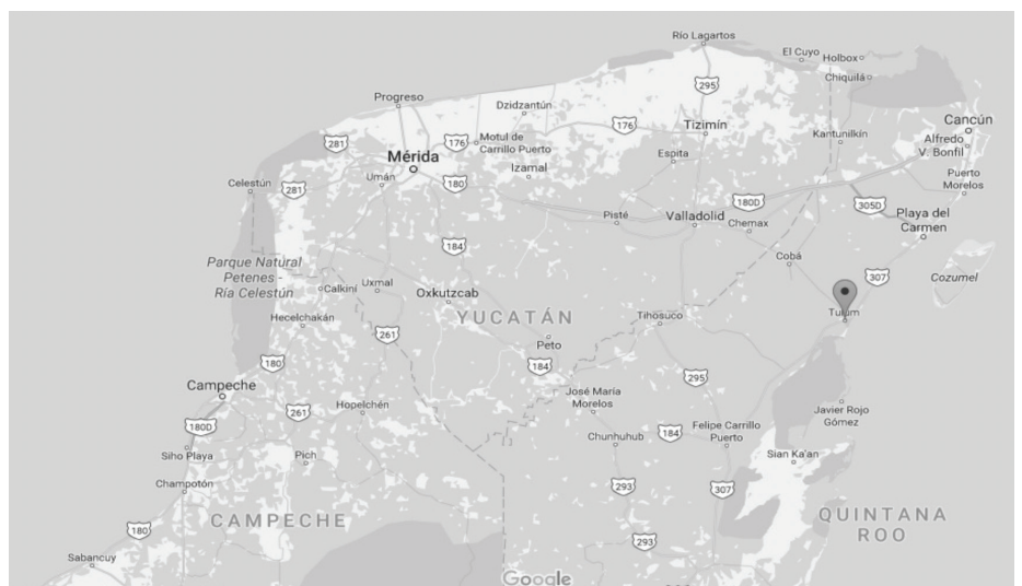
Figura 1. Ubicación de Tulum, Quintana Roo, México

La ciudad de Tulum es uno de los principales polos turísticos del estado de Quintana Roo, México (CONACULTA-INAH, 2010). Debido a la gran riqueza y amplia diversidad de comunidades vegetales existentes (selva mediana y baja, manglares, tóntales, dunas costeras, arrecifes de coral, entre otros), favoreciendo estos factores que a partir del 2001 sea considerado como parte del corredor turístico Cancún Tulum (SEMA, 2001), generando así un importante sitio de interés turístico. Tulum se ubica entre los paralelos 19°47' y 20°31' de latitud norte, los meridianos 87°18' y 88°00' de longitud oeste; altitud entre 0 y 100 m. (figura 1). Colinda al norte con los municipios de Lázaro Cárdenas y Solidaridad; al este con los municipios de Solidaridad y Cozumel y el Mar Caribe (Mar de las Antillas); al sur con el Mar Caribe (Mar de las Antillas) y el municipio de Felipe Carrillo Puerto y al oeste con el municipio de Felipe Carrillo Puerto, la Zona Interestatal de Quintana Roo Yucatán y municipio de Lázaro Cárdenas (INEGI, 2009: 2).