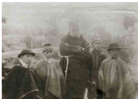
Figura 2. “Niños civilizados y niños incivilizados”, convento de Santa Magdalena de Altötting, provincia de Baviera (Alemania) Reverso de la fotografía 31

la instalación de instituciones estatales donde la escuela fue particularmente gravitante en la configuración de una nueva realidad sociocultural 29 . En esas escuelas e internados que comenzaron a surgir y distribuirse por el Wajmapu , se desarrolló un intenso proceso formativo de moralización y enseñanza práctica, se formarían sujetos disciplinados y productivos para que fueran útiles a las demandas de la sociedad chilena 30 .