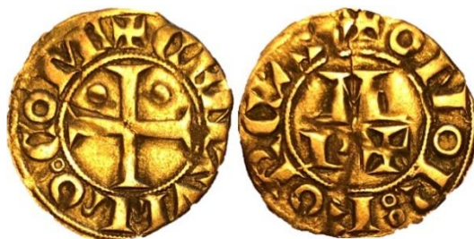
CB:2.1: Tarpes -Condado de Bigorra- (ca. 1114-ca. 1124) -y opcionalmente Morlá, Vizcondado de Bearn, ca. 1070 a 1095-. Sin Marca. P: 0,77. R: 3. Museo Arqueológico Nacional, Ref. 2018/45/8.