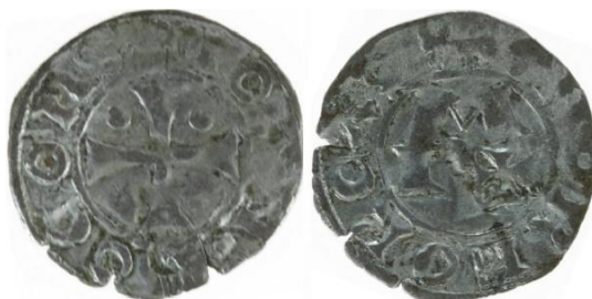
CB:2.2: Tarpes -Condado de Bigorra- (ca. 1114-ca. 1124). -y opcionalmente Morlá, Vizcondado de Bearn, ca. 1070 a 1095-. Sin Marca. P: 0,60. R: 3. Arca Santa de la Catedral de San Salvador de Oviedo, Ref. 04/2018.