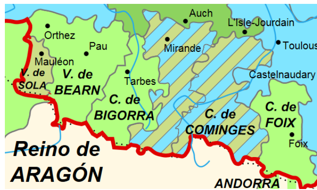
Mapa del Vizcondado de Bearn y del Condado de Bigorra

El primero de ellos fue, como ya hemos dicho, Céntulo V de Bearn -apodado “el Joven”-, que a su vez ejerció como conde Céntulo I de Bigorra tras su matrimonio en 1080 con la verdadera heredera y condesa de esta Marca, doña Beatriz I, que seguiría actuando como tal hasta su fallecimiento acaecido en 1095 o 1096. No obstante, y pese a ser ella la detentora del poder bigorrense, Céntulo I -o V-, utilizó esta unión conyugal para controlar Montaner y Bigorra, afianzando durante estos años una estrecha y sólida alianza con el reino de Aragón. Así y de esta guisa es como llegaría a ser parte integrante principal de la Curia regia de Sancho V Ramírez, y caballero de plena confianza de este eminente rey aragonés, participando activamente a su favor en un primer intento por tomar a los musulmanes la ciudad de Zaragoza –“ Caesar Augusta ”-, en 1079. Si bien ésta acometida no fructificó al ser repelida por el Cid -que a la sazón estaba al servicio de los ismaelitas-, no es menos cierto que debido a la intensidad de su combate y a su entrega en favor de los intereses soberanos aragoneses, fue ampliamente agasajado y premiado por don Sancho que le llenó de parabienes. Así discurrió el resto de su vida hasta que, posteriormente, luchando de nuevo junto al mismo monarca en la toma de Huesca de 1090, falleció durante su asalto, entregando pues su vida por la corona del reino de Aragón en una demostración de heroicidad pocas veces vista.