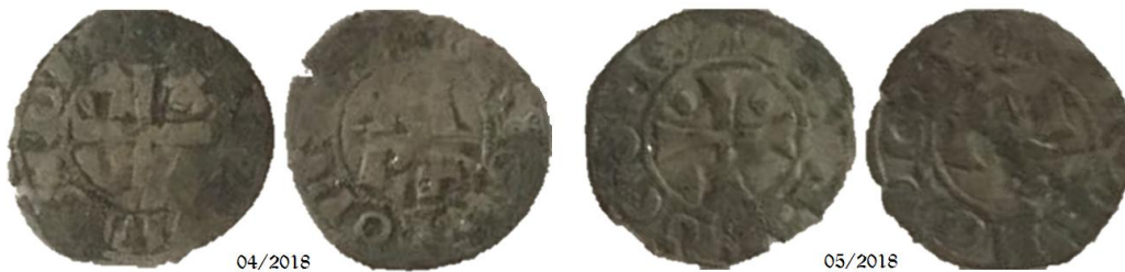
Dineros del Conde Céntulo de Bigorra encontrados en el Arca Santa de Oviedo

Estas serían por tanto las razones de fondo que justificarían porqué no es raro encontrar piezas de esta estructuración bernesca o bigorrense tanto en la actual provincia de León -camino francés (entorno del río Esla)- como en la propia Asturias -camino primitivo (Catedral de Oviedo)-, amén, por supuesto, de en Aragón y Navarra. Y de cuya circulación en el siglo XII son fieles testigos ambos denarios -referenciados como 04/2018 y 05/2018-, que aparecieron enclavados en el Arca Santa ovetense 9 .