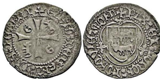
Fig. 3: + Gasto * Dei * Gra * Dns * Bearn / Pax * Et * honor * Forqvie * Morl

A tenor pues de todo lo expuesto sobre estas amonedaciones que tantas especulaciones han suscitado durante años, todo parece indicar, que fueron iniciadas en Morlá por Céntulo V de Bearn hacia entre 1058 y 1080 (Véase CB:1 y CB:4), pero que permitió que circularan en Bigorra a partir de su matrimonio con Beatriz I en ese mismo año de 1080, circunstancia que se mantuvo hasta el fallecimiento de esta en 1095 -ya como condesa exclusiva, pues su marido había muerto en cinco años atrás-. Tanto Gastón IV para Bearn como Bernardo III para Bigorra, aceptaron tácitamente mantener esta situación durante sus soberanías, acuñando posteriormente Céntulo II una presumible segunda emisión entre 1114 y 1128, acaso en la ciudad de Tarbes (Véase CB:2), a la que se unió también según nuestro criterio, el mencionado Gastón IV manteniendo el mismo esquema de diseño previo (Véase CB:3). Todas ellas, fueron pasando lentamente a territorio hispánico entre 1089 y 1128, debido a la vinculación vasallática de Bearn y de Bigorra con el reino de Aragón -representado en las personas de Sancho V Ramírez primero y más tarde de Alfonso I el Batallador- como parte del camino de peregrinación a Santiago de Compostela que era; y además, como detonante o consecuencia directa de los intentos por tomar para la Cristiandad y para la corona aragonesa, la “Ciudad Blanca- madinat albaida ” de Zaragoza 12 .