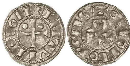
CB:1.2: Sin Marca. P: 1,12. R: 3. Col. Manuel Mozo (Madrid).

Anv: Id. CB:1.1. L: termina solo en “COM”.