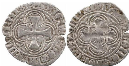
Fig. 2: [Vaqueta] Gaston* Dominvs* Bearni* / + Pax* Et* Honor* Forcas* Morlan