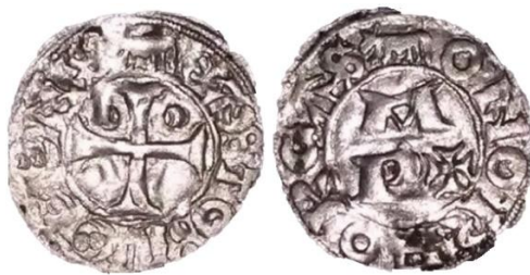
Fig. 1: [Vaqueta] Gasto: Lo Coms / [Vaqueta]Onorforcas 11

Si revisamos acuñaciones posteriores de estas dos últimas casa solariegas, veremos cómo pese a todas las vicisitudes pasadas en estos siglos de uniones y alianzas, en la mayoría de ellas se mantiene el lema “ Pax Onorforcas ”, al que se le añade una “vaqueta” o vaca -símbolo bobino ancestral omnipresente en las armas de Bearn- (Véase Fig. 1), que probablemente fue entallada por Gastón IV (Véase CB:3), y que progresivamente fue derivando hacia expresiones del tipo “ Pax et Honor Forcas Morlan[is] ” -alusiva a la ceca donde definitivamente se fabricaron- (Véase Fig. 2), o el más explícito de “ Pax et Honor Forqvie Morl[anis] ”, en el que la palabra “ forqvie ” parece ya invocar más el concepto “fortaleza” o “castillo” que a “fuerza” 10 (Véase Fig. 3), como hasta ahora hemos venido presuponiendo.