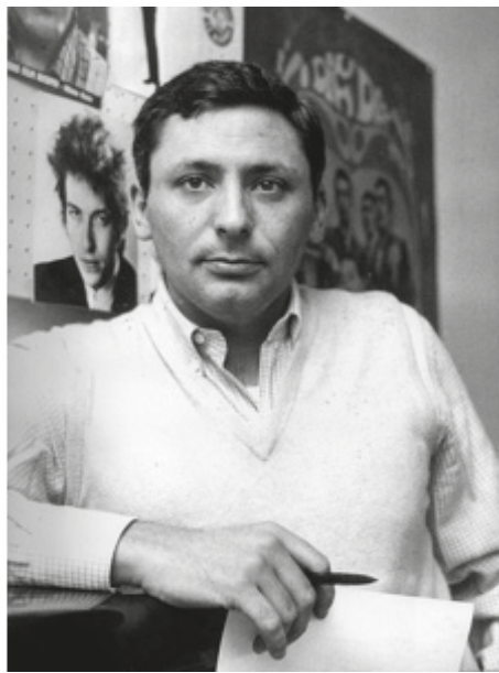
Giulio Rapetti "Mogol" (1968)

Noi vorremmo che questi piccoli e imperfetti saggi di traduzione fossero, prima di tutto, degli inviti all'ascolto, a scoprire, e a riscoprire, uno dei più grandi "creatori di emozioni" del secolo passato. Le sue canzoni senza tempo a volte ci sembrano venire da un ipotetico mondo futuro, ma non smettono di parlare e di commuovere ancora gli ascoltatori di oggi, in un mondo che più che mai sembra "non volerci più".