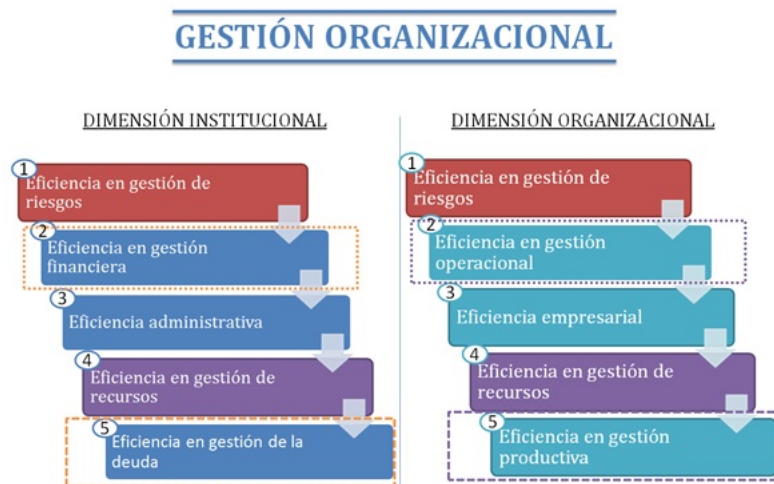
FIGURA 3 Resultados gestión organizacional

En esta última categoría la gestión de riesgos constituye el código con mayor saturación en las dimensiones organizacional e institucional. No obstante, los demás códigos marcan una diferencia radical entre las dos dimensiones objeto de análisis, que denotan una importancia significativa de la eficiencia operacional en la dimensión organizacional, en tanto que la eficiencia financiera destaca en la dimensión institucional. La figura 3 detalla en orden descendente, por dimensión, los cinco códigos sobre gestión organizacional que aparecen con mayor frecuencia en los documentos analizados.