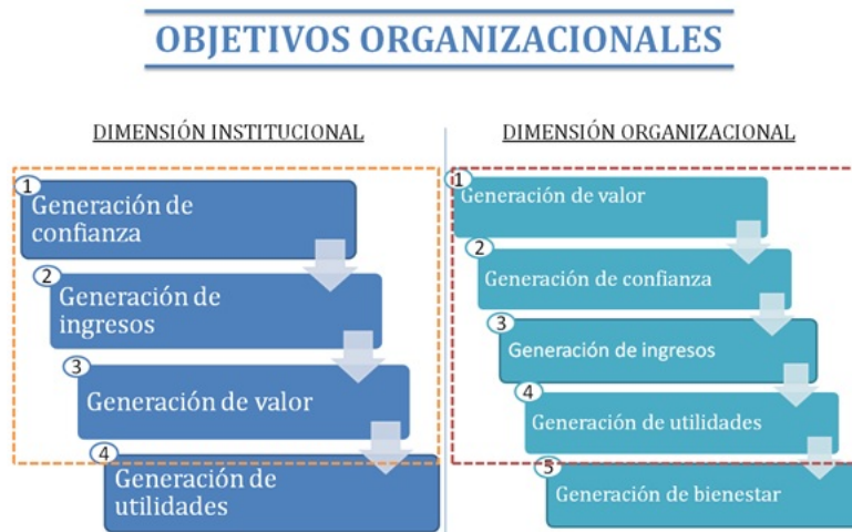
FIGURA 2 Resultados objetivos organizacionales

De esta manera, el análisis de co-ocurrencias se direccionó en función de la generación de valor y la generación de confianza. No obstante, dado que la generación de valor tan solo co-ocurre con un código en más de una ocasión, se optó por extender el análisis a la generación de ingresos, el cual constituye el tercer código más relevante de la segunda categoría orientadora. La tabla 5 detalla los resultados de las co-ocurrencias para los objetivos organizacionales.