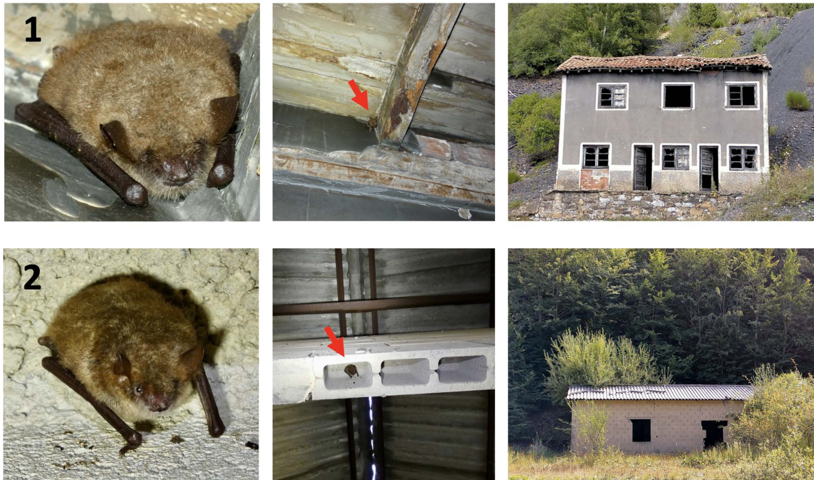
Figura 2. Murciélagos ratoneros pardos ( Myotis emarginatus ) localizados por los autores descansando de forma solitaria (flecha roja) en refugios presentes en estructuras humanas: (1) una pequeña casa abandonada y (2) una nave para guardar ganado.

ejemplares se encontraron de forma solitaria en estructuras humanas abandonadas, concretamente una pequeña casa y una nave para guardar ganado (Fig. 2). M. emarginatus muestra predilección por hábitats que cuenten con cobertizos de ganado y los utiliza como refugios, siendo frecuente que la especie cace en las proximidades de los rebaños de animales domésticos (Dietz et al. 2007). El hábitat donde se han localizado los individuos es un bosque mixto caducifolio donde dominan las hayas ( Fagus sylvatica ) y en menor medida el roble melojo ( Quercus pyrenaica ). La elevación media de los dos lugares donde se han observado a los individuos es de 1.250 m.s.n.m.