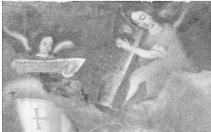
3. Ángel arpista. Detalle de “Cuadro de Ánimas”. Betancuria (Fuerteventura)

irreales o idealizados por el artista e imitarían a las arpas renacentistas y góticas: línea estilizada, clavijero poco pronunciado y columna curva. En uno de los dos casos podemos observar la caja de resonancia recta y delgada.