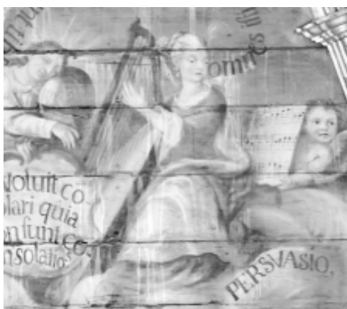
7. La Persuasión. Detalle de la Bóveda de la Capilla de los Dolores. Icod de los Vinos (Tenerife)