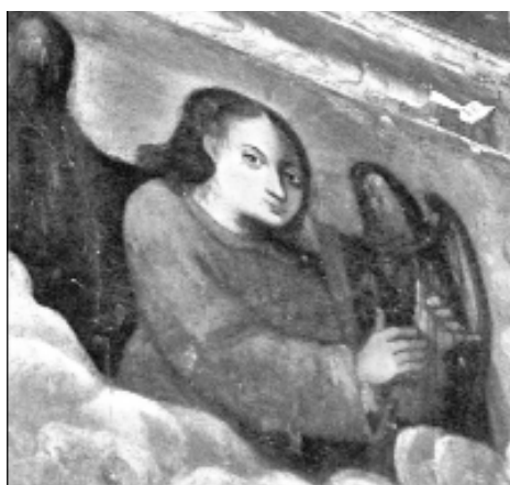
6. Ángel arpista. Detalle de “Altar de S. Tomás de Aquino”. I. de S. Domingo