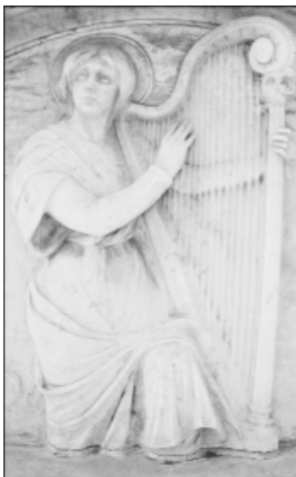
14. Detalle del Panteón de Esmeralda Cervantes. Cementerio de Santa Lastenia (Santa Cruz de Tenerife)

El instrumento presenta, claramente, características de los modelos de arpa clásica de algunos constructores franceses del último tercio del siglo XVIII, es decir, un