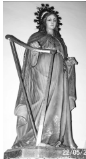
17. “Santa Cecilia” Buenavista del Norte (Tenerife)