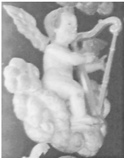
12. Ángel arpista. Altar mayor de Ntra. Señora de las Nieves (La Palma)

Monumento de Interés Histórico Artístico. El instrumento en cuestión se trata de un modelo irreal, de inspiración gótica, que presenta el característico alargamiento de las arpas de transición entre el Renacimiento y el Barroco. Aunque parece hecha de una sola pieza, podemos distinguir en ella tres partes: caja de resonancia recta y delgada, columna con curva pronunciada, consola ligeramente curva, codo y tres cuerdas. No presenta ningún tipo de decoración. El instrumento es sujetado con la mano derecha mientras que es tañido con la izquierda.