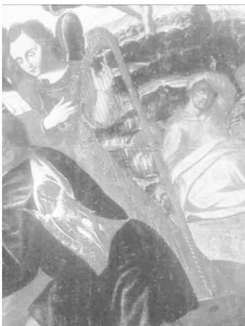
1. Ángel arpista. Detalle de “La Adoración de los Pastores”

• “La Adoración de los Pastores” (S. XVII). Óleo sobre lienzo. Gaspar de Quevedo (1616-d.1670). Ayuntamiento de San Cristóbal de La Laguna (Tenerife). Depósito Municipal. Es la mejor representación de un arpa barroca, o quizás renacentista, en el arte canario, aunque es de un solo orden o hilera de cuerdas. Sus características morfológicas son las siguientes: clavijero en forma de \frac{1}{28} horizontal y poco elevado en el extremo de la columna con dos remates (uno en forma de voluta), columna delgada y torneada, siete costillas que forman la caja de resonancia, 20 cuerdas con sus respectivas clavijas de hierro forjado, tabla armónica está protegida por unos botoncillos circulares (que suelen ser de madera) y unas lañas o grapas de hierro superpuestas a estos para que no de desgarre debido a la presión que las cuerdas ejercen sobre la tabla, varios