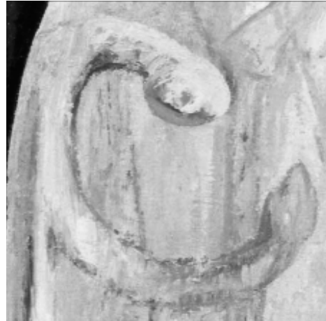
9. Detalle de “La Ascensión del Señor a los Cielos” (Artenara) Patrimonio eclesiástico de Gran Canaria. Intervenciones 03-07. Cabildo de GC, pp. 44-45