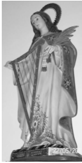
16. “Santa Cecilia” Santiago de El Teide (Tenerife)