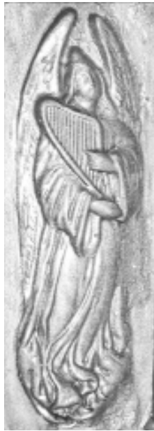
15. Detalle de la decoración del arpa “Erard” del CPM de Santa Cruz de Tenerife

Del escultor grancanario Ángel Peres tenemos referencias de “ Rey David ”. Relieve en Cobre (París). Propiedad particular 37 .