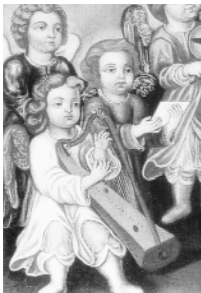
5. Ángel arpista. Detalle de “Tránsito de San Francisco”. La Laguna (Tenerife)

parece más bien un rectángulo, siendo la curvatura de la consola poco pronunciada. No posee caja de resonancia ancha y su columna es plana. No se distinguen cuerdas, seguramente por tratarse de un boceto. El proyecto no se realizó.