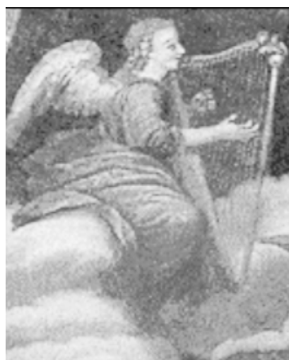
2. Ángel arpista. Detalle de la “Cúpula de la I. de San Fco. De Borja”