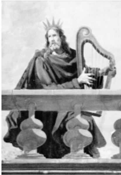
8. Rey David. Detalle “Bóveda Capilla Mayor “, I. del Salvador. Santa Cruz de La Palma. F G i