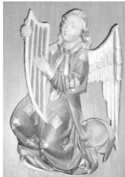
13. Ángel arpista. Altar mayor de la iglesia de San Francisco. Puerto de la Cruz (Tenerife)

• “Altar de Nuestra Señora del Perpetuo Socorro y San Alfonso I de Ligorio de la Iglesia de San Gregorio”. Telde (Gran Canaria). Ángel arpista 27 . Relieve escultórico de un ángel arpista dentro de una pequeña hornacina con forma de concha. Se trata de un instrumento irreal de pequeñas dimensio-