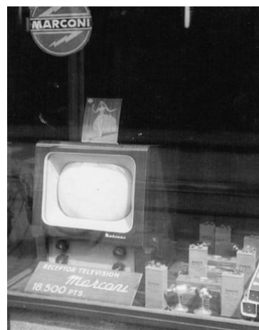
Figura 1. Primer televisor expuesto en un escaparate de la región. Año 1952.