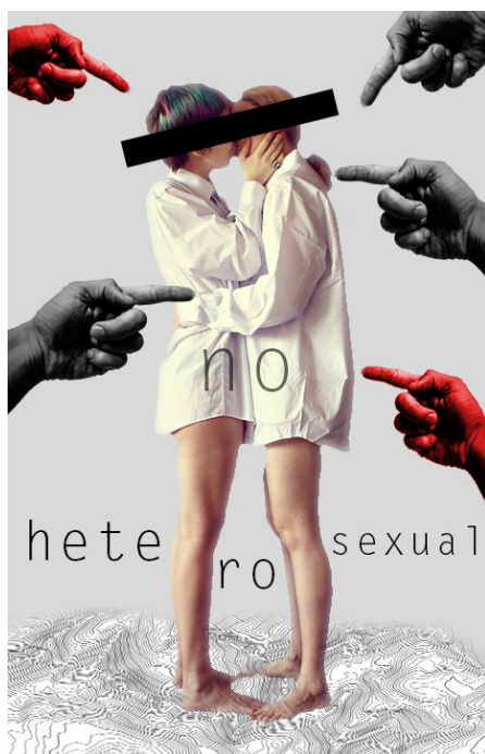
FIGURA 1 | Imagen dialéctica sobre la violencia y la invisibilización LGBTI

A pesar de las múltiples violencias propiciadas por una sociedad heteronormativa, que han obligado al no reconocimiento e invisibilización de una comunidad (ver Figura 1), podemos identificar en los territorios procesos de transformación y mutación que se potencializan con la génesis de un morar. El departamento del Quindío ha sido receptor y caldo de cultivo para este nuevo morar, y en él se evidencian relaciones violentas que siguen intensificando el dolor de quienes han sido desterrados. “En Armenia, por ejemplo, paramilitares amenazaron a una mujer lesbiana víctima del conflicto y defensora de derechos humanos, a quien acusaron de ser una ‘guerrillera’ y amenazaron para que abandonara su trabajo con la Mesa Departamental de Víctimas del Quindío” (Colombia Diversa; Caribe Afirmativo, 2018: 66).