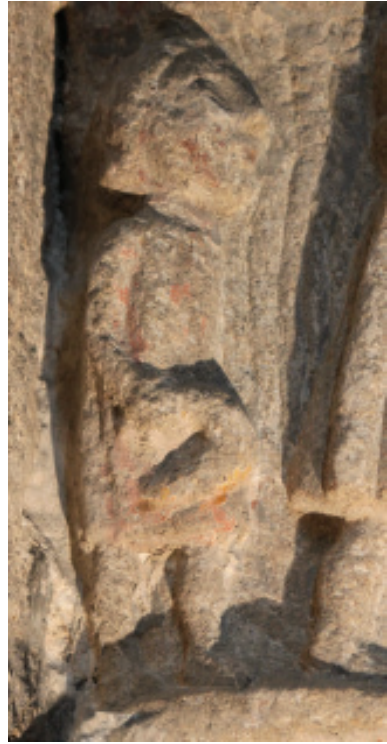
Figs. 11-12.- O mes de Xullo no calendario agrícola de Santa María do Azogue en Betanzos (s. XIV), único completo que se conserva da Galicia medieval.

O segador aparece de perfil, amosando o fouciño ou serrana na súa man dereita, mentres mira o cereal (trigo, se supón), que aparece moi esquematicamente figurado diante del. Debuxo e foto: Alfredo Erias®.