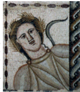
Fig. 8.- O Verán no mosaico romano das Catro Estacións, na Casa de Baco en Complutum (Alcalá de Henares, Madrid).

Curiosamente, no mundo cristián, canonizárase no s. XVII un santo do s. XII, san Isidro Labrador, que se figura frecuentemente (en Francia, sobre todo) cun manoxo de cereal na súa man esquerda e cun fouciño na súa dereita. Debuxo e foto: Alfredo Erias®.