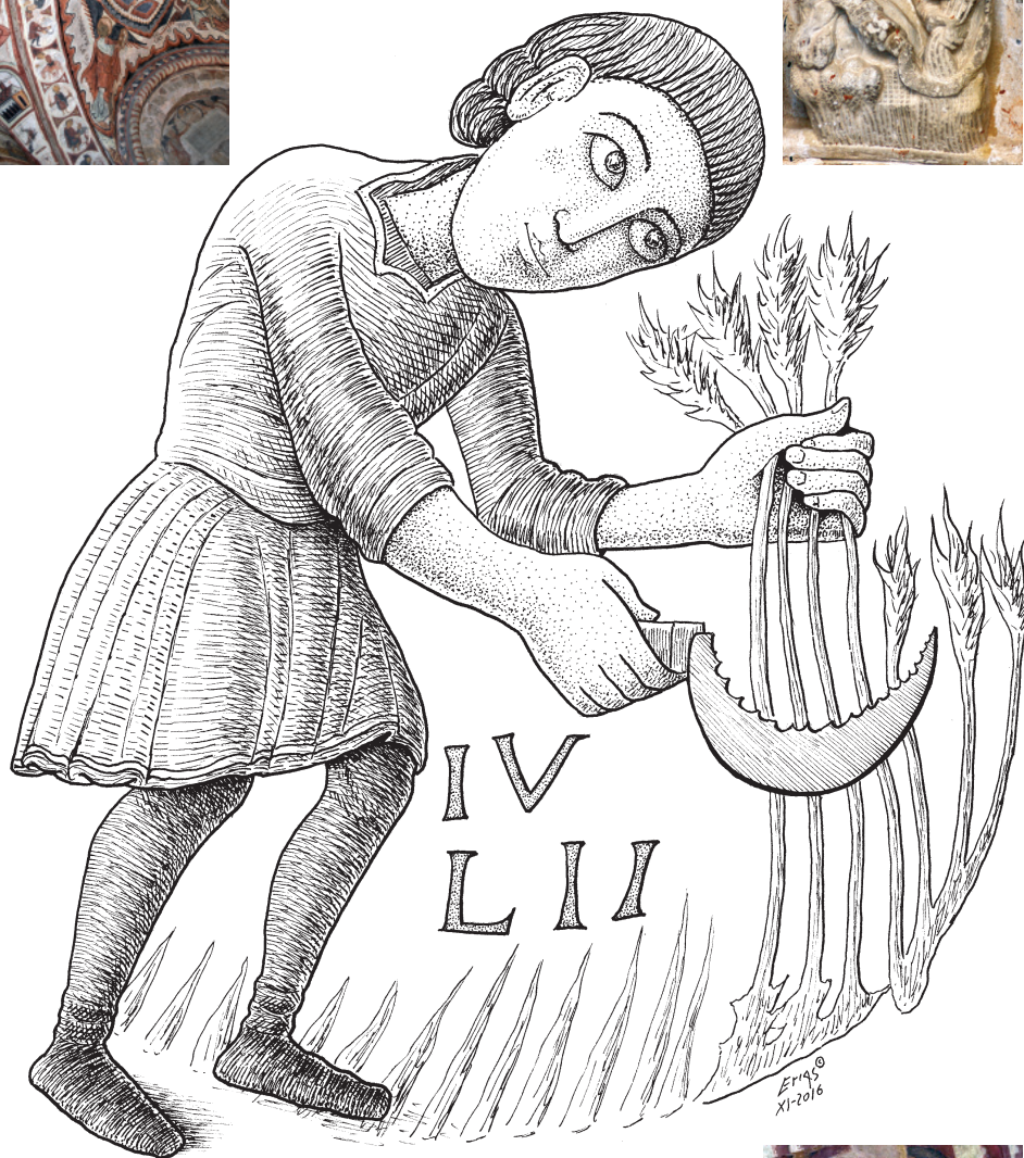
Figs. 1-3.- O mes de Xullo («IVLII») como segador que está a segar o trigo con serrana (por definición, dentada). Forma parte do calendario agrícola da real basílica de San Isidoro de León (s. XI-XII), que se desenrola en medallóns de 38 cm de diámetro e se atopa pintado no intradós do arco formeiro, situado á dereita de Cristo en Maxestade. Unha imaxe esta que, á maneira clásica, funciona (en relación co calendario do arco) como Cronocrátor ou Señor do Tempo, lembrando as imaxes romanas do deus Aión ou do Xenio do Ano, que moven a roda das constelacións. Debuxo: Alfredo Erias®