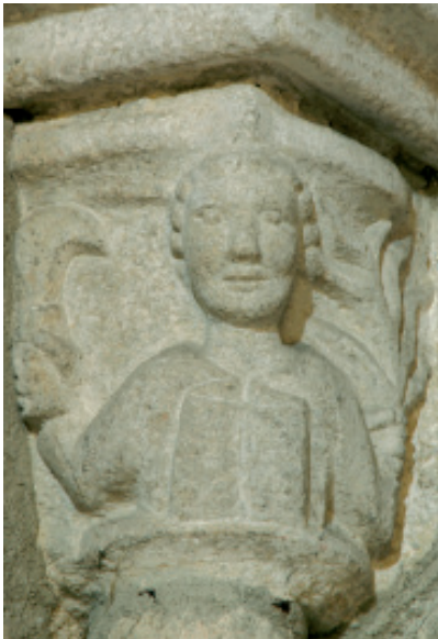
Figs. 6-7.- Representación do Verán como un segador, unha imaxe tomada directamente de Roma, onde o segador por excelencia era Saturno, deus da Agricultura. Igrexa de Santa María do Azougue (s. XIV), Betanzos, capela absidal do evanxeo.

Curiosamente, no mundo cristián, canonizárase no s. XVII un santo do s. XII, san Isidro Labrador, que se figura frecuentemente (en Francia, sobre todo) cun manoxo de cereal na súa man esquerda e cun fouciño na súa dereita. Debuxo e foto: Alfredo Erias®.