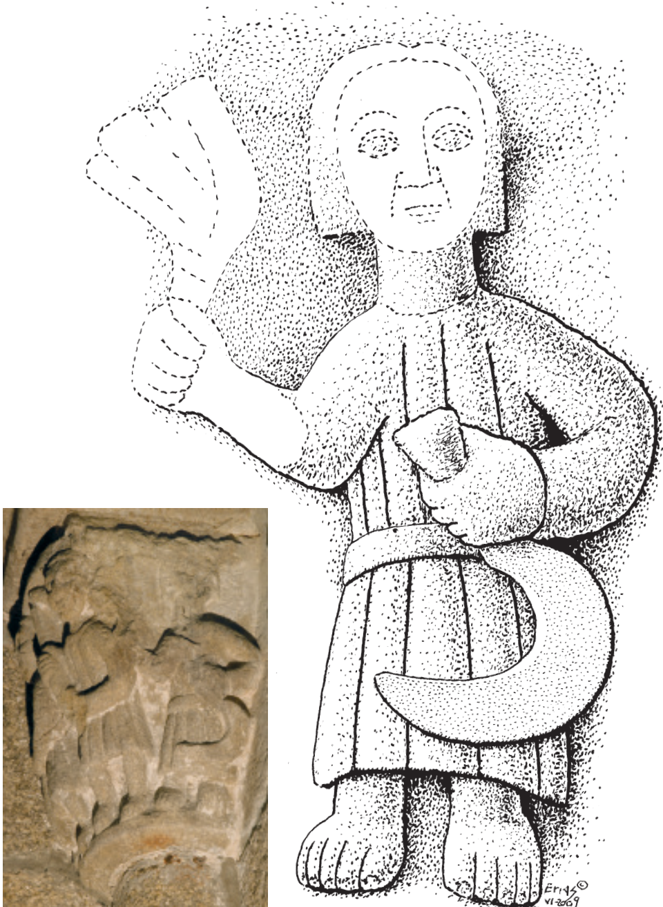
Figs. 9-10.- Unha derivación da imaxe romana do Verán é esta do segador (mes de Xullo) visto de corpo enteiro, que sigue a amosar, iso si, o manoxo de cereal nunha man e o fouciño (ou serrana) na outra, pero sen estar segando. Atópase nun capitel da capela do evanxeo da igrexa de San Francisco de Betanzos (s. XIV), con outros dous meses dun incompleto calendario agrícola. Debuxo e foto: Alfredo Erias®.