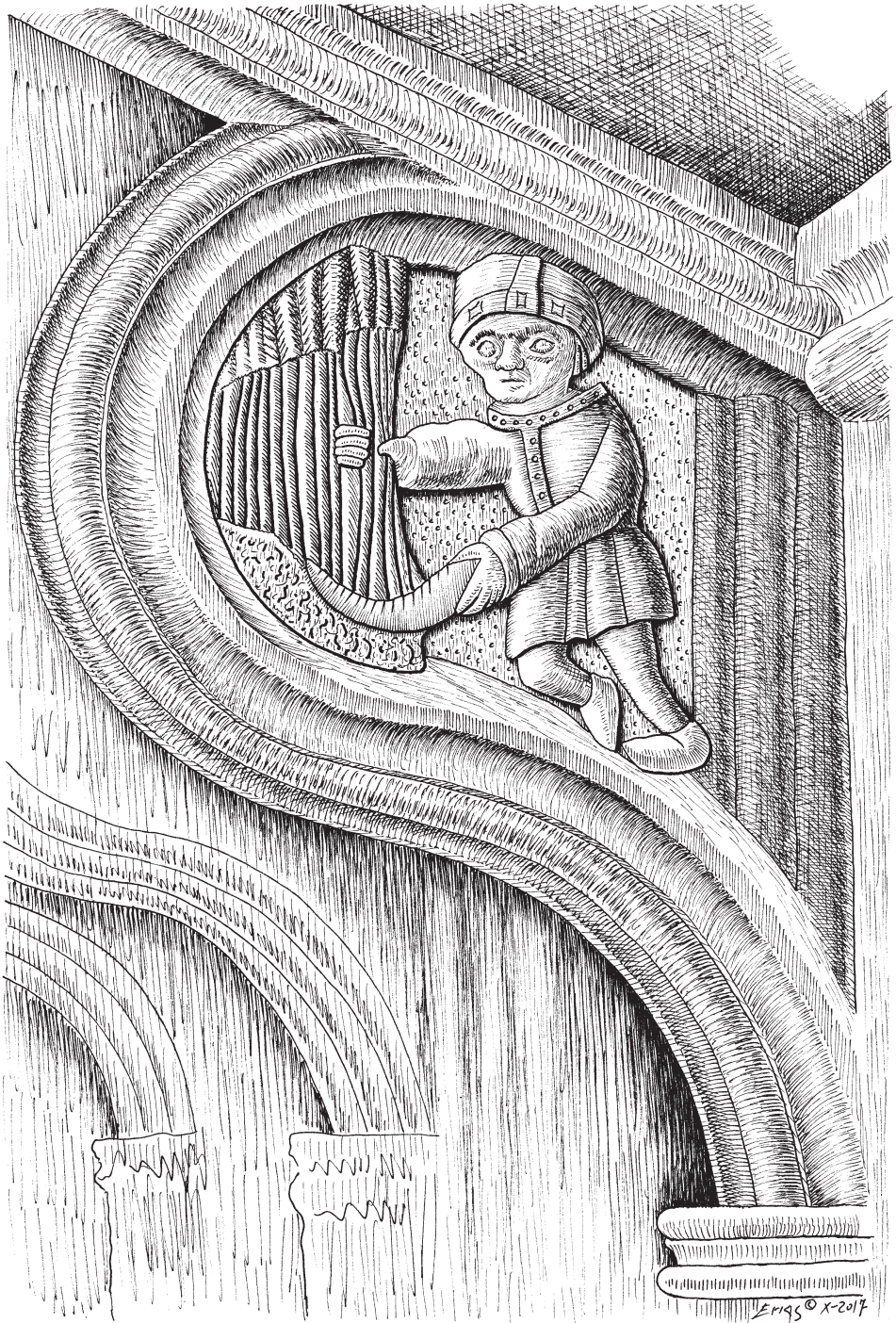
Fig. 13.- Imaxe emblemática do mes de Xullo, como segador en acto de segar trigo, no coro alto, tardogótico (s. XVI), da igrexa mosteiral de Celanova. Debuxo: Alfredo Erias®.