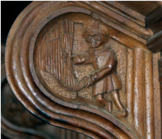
Fig. 18.- Mes de Xullo no coro alto, tardogótico (s. XVI), da igrexa mosteiral de San Salvador de Celanova. Foto: Alfredo Erias®.

Figs. 14-17.- No coro alto da igrexa de San Salvador de Celanova aparecen os bustos da raíña e emperatriz Isabel de Portugal (con inspiración no retrato de Tiziano) e do rei e emperador Carlos (Carlos I de España e V do Sacro Imperio Romano Xermánico) (fotos: < https://commons.wikimedia.org > e Alfredo Erias®). O casco que vemos representado na talla do emperador inspírase no realizado por Kolman Helmschmied (Augsburgo, Alemania, 1471-1532) (foto: Patrimonio Nacional). Como queira que casaron o 1 de marzo de 1526, entre esta data e aproximadamente 1530 deberon rematarse as obras do coro, que ten outros elementos renacentistas. Pero como a estrutura xeral, a ornamentación e o concepto da maior parte dos seus motivos é tardogótico, cabe pensar que o deseño e inicio da obra pode retrotraerse á primeira ou segunda década do s. XVI.