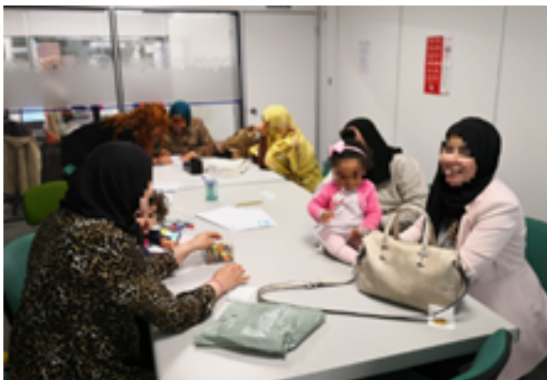
Imagen 2. Grupo de conciliación al que las alumnas acuden con los bebés a su cargo.

En la enseñanza presencial las actividades tienen como público diana a aquellas personas con especial dificultad para conciliar su vida personal con la formativa. Así, una de las clases más demandadas en la que denominamos informalmente grupos de mamás (imagen 2) puesto que están conformadas por mujeres que acuden a las clases de español como segunda lengua acompañadas de sus criaturas menores de tres años. Se trata de personas que, por diversos motivos, no han podido acceder a dispositivos de escolarización de primer ciclo de educación infantil.