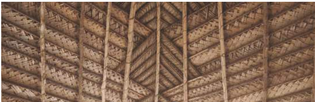
Comunidad matsés de Puerto Alegre, Río Yaquerana, Perú.