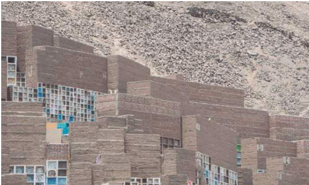
Necrosis Urbana. Cementerio Santa Rosa, Callao, Perú.