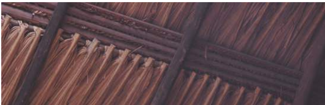
Estructura de cubierta en madera. Reserva Natural El Matuv, corregimiento de Palomino, La Guajira, Colombia.