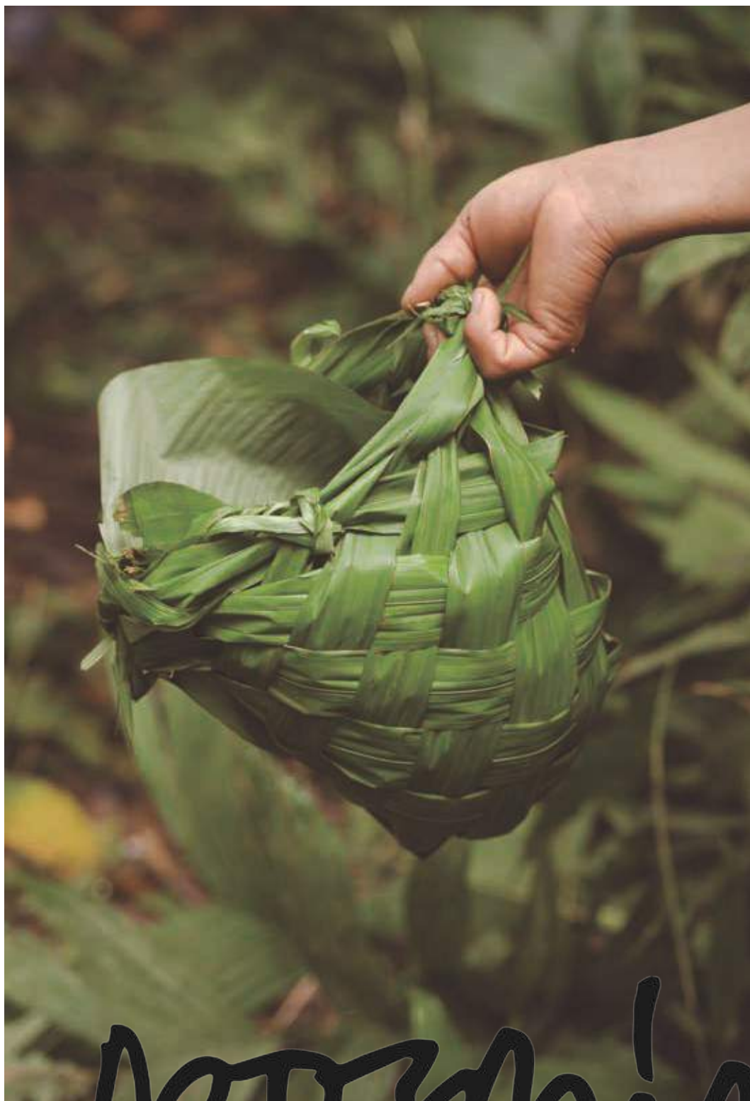
Puerto Alegre, Río Yaquerana, Perú.