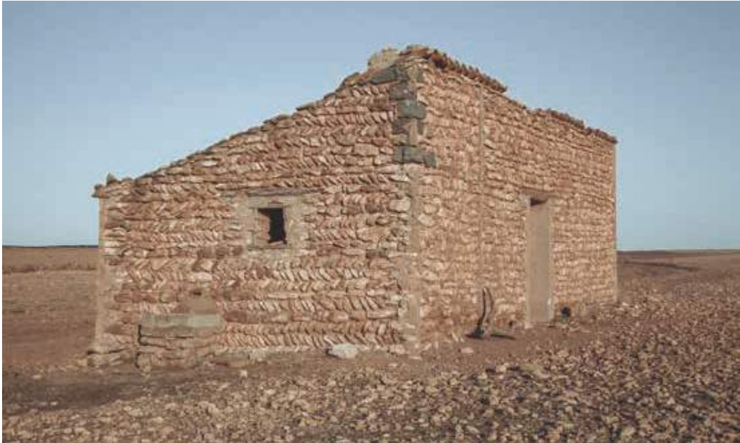
Arquitectura y resistencia. Popular contemporánea. Lleida, España.