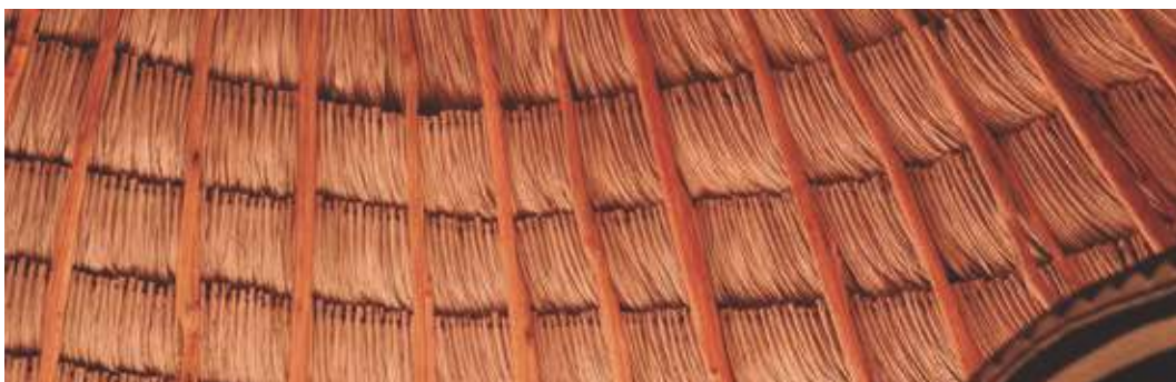
Kiosco "La Bendición de Dios", Piojón, Atlántico, Colombia.