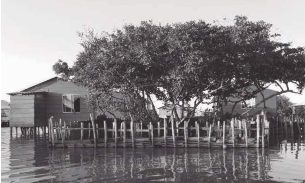
Vivienda anfibia, palafítica. Nueva Venecia, Ciénaga Grande de la Magdalena, Magdalena, Colombia.