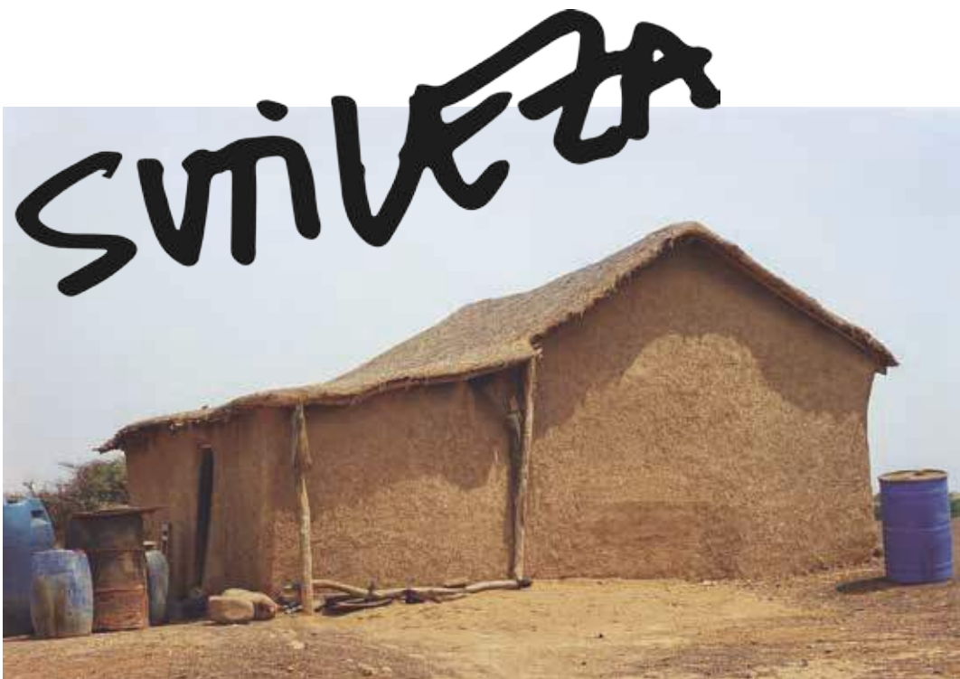
Arquitectura popular o de autogestión. Península de Paraguaná, Venezuela.