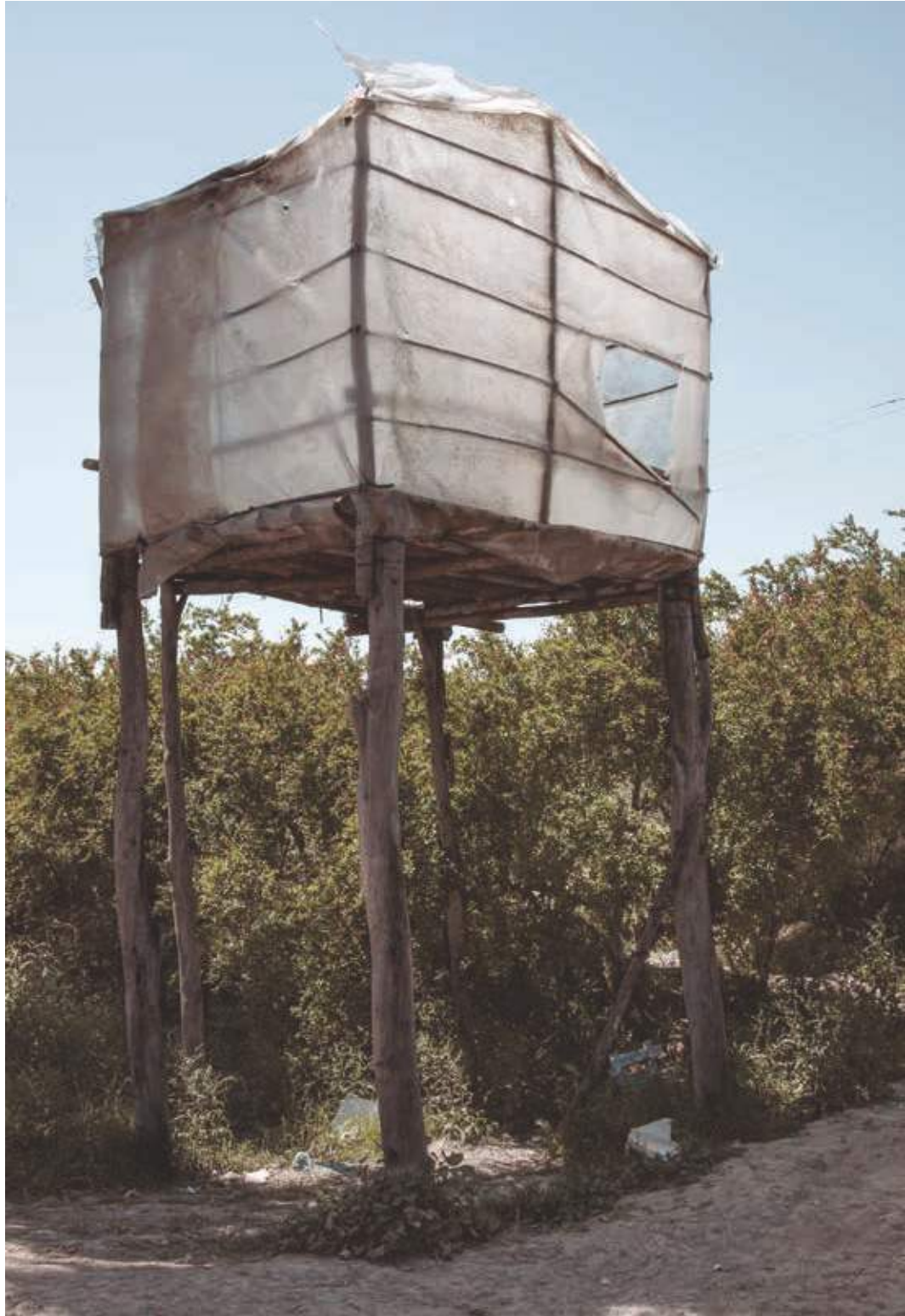
Arquitectura y resistencia. Efémera. Granada, España.