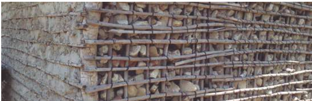
Cerramiento de doble enmallado en Lata de Corozo. San Juan Nepomuceno, Bolívar, Colombia.