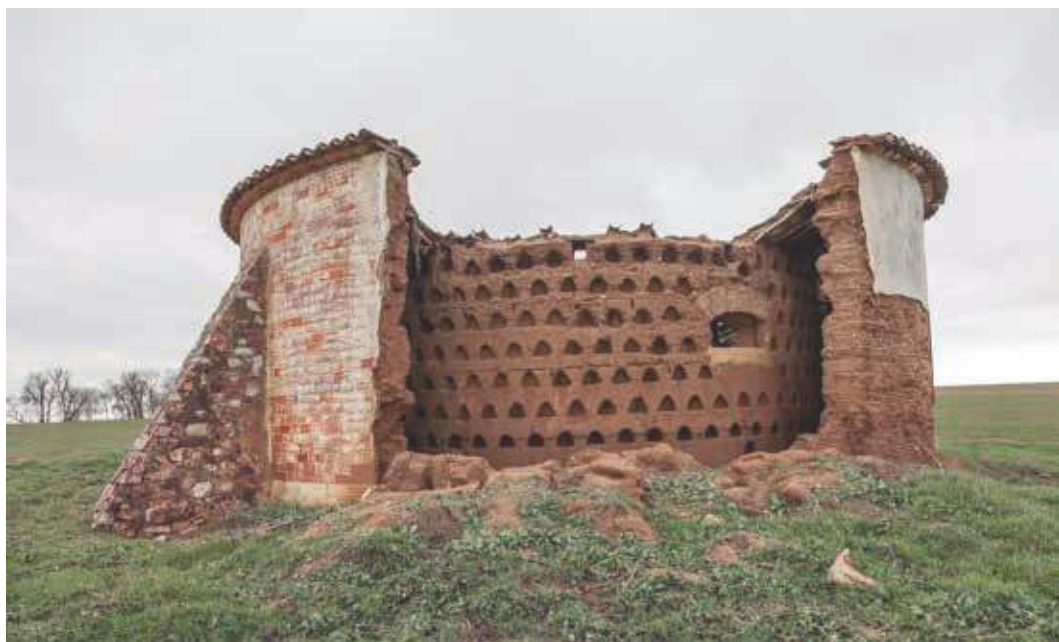
Arquitectura y resistencia. Popular vernácula. Palencia, España. Fotografía: Nicolás Combarro