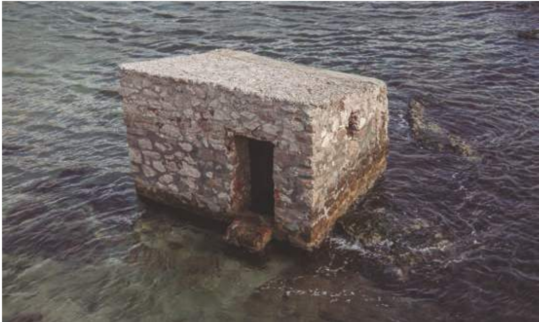
Arquitectura y resistencia. Autoconstrucción. Toulouse, Francia.