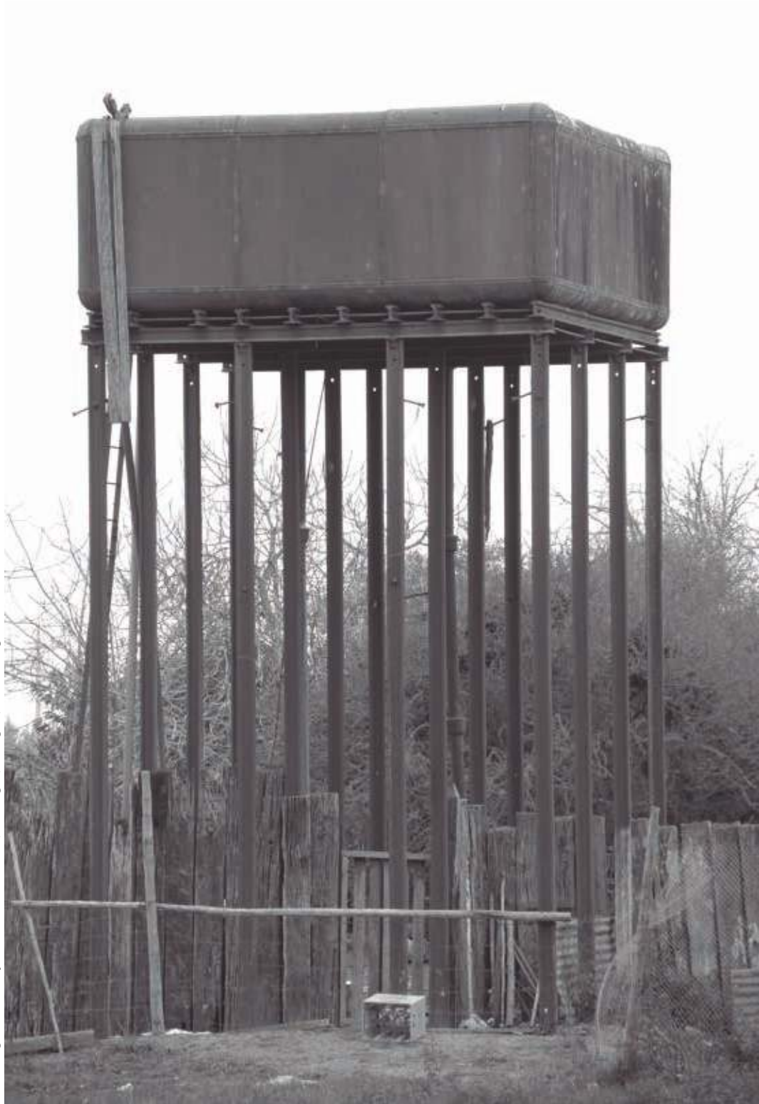
Torre de agua de hierro y rieles de tren. Alcones, Marchigüe, VI Región, Chile.