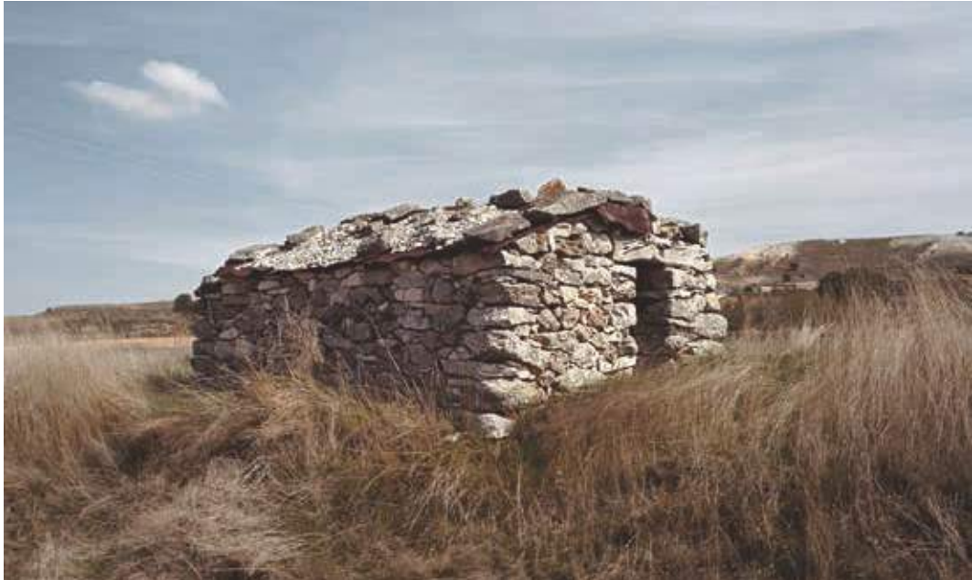
Arquitectura y resistencia. Cuenca, España.