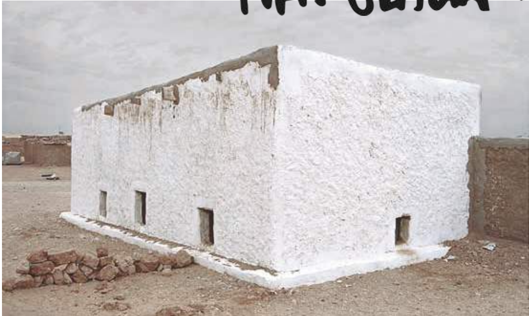
Arquitectura y resistencia. Política. Tindouf, Argelia.