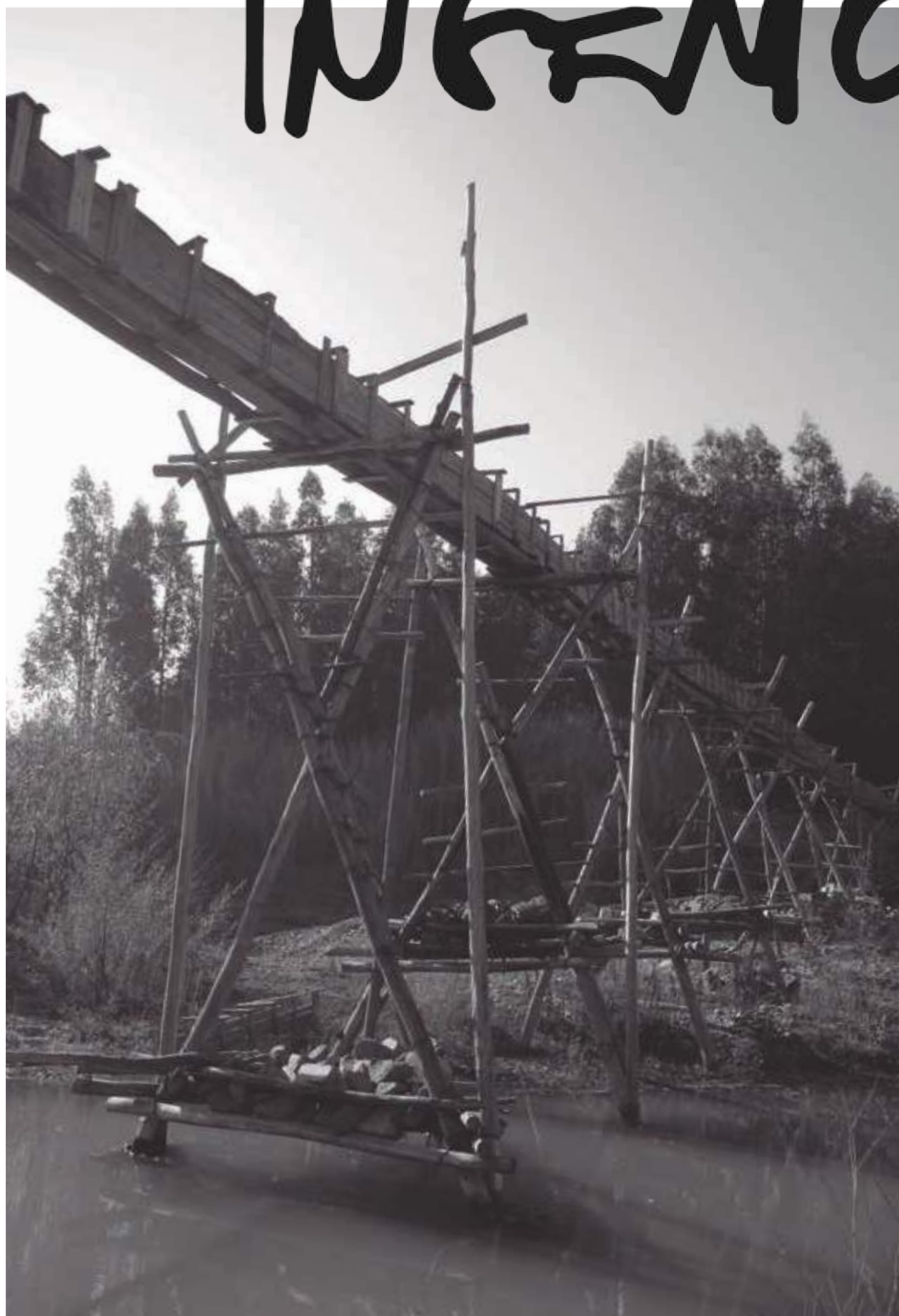
Acueducto rural sobre el río Tinguiririca. Apatla, VI Región, Chile.