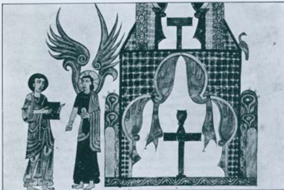
Altars representats al Beatus de Girona.

rectangular i en un suport més petit que la mesa que sostenia, format per carreus o bé per una peça de pedra monolítica, dita en aquest cas i en llenguatge tècnic "tenant" (és a dir, allò que "té" o "sosté" la part important de l'altar, que és l'ara, com sabem). Els peus fets a base de carreus, més matussers que els monolítics de pedra, corresponen a construccions més rústegues. En canvi, els altars amb un pilar de pedra els trobem en edificis més rics. Les grans esglésies tenien meses d'altar més grans que no podien sostenir-se amb un únic "tenant" i normalment descansaven sobre cinc pilars, un a cada punta i el cinquè al centre.