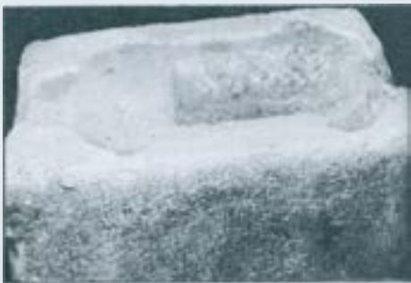
Reconditori del tenant de Sentmenat.

Tenim també una demostració de l'antiguitat d'aquestes formes en una