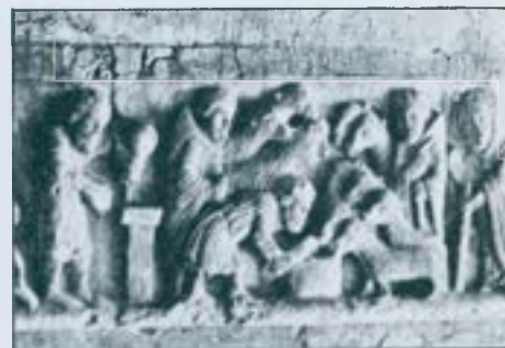
Catedral de Girona: Sacrifici de Jacob.

(que tant podia estar en la pròpia ara com en el peu) anomenada "reconditori" que albergava d'una manera recòndita (d'aquí en ve el nom) les relíquies dels sants, i també a vegades pergamins i records diversos de la consagració de l'altar; tancat tot dintre d'una arqueta dita "lipsanoteca". En el cas d'altars grans el reconditori estava justament en el pilar central. S'han trobat lipsanoteques de materials i formes molt diversos: arquetes de fusta, d'alabastre o altres pedres, de plom, flascons de vidre i