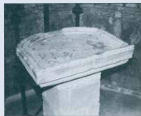
Sant Feliu de Vilamilans.

Sobre l'altar només s'hi col·locaven les ofrenes i algun ciri per fer llum. La creu, que normalment es penjava del sostre, no tenia cap imatge. No fou fins més tard quan hi aparegué la imatge de Crist: no pas però el Crist crucificat, sino la representació de la seva majestat, atribut que donà nom a les imatges que