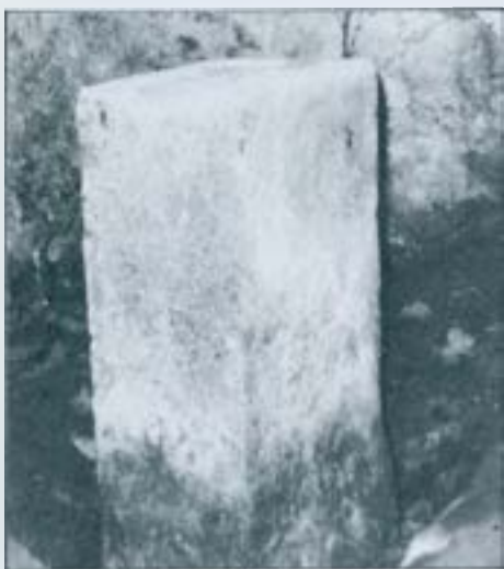
Tenant de Sentmenat.

Un cop col·locada l'ara en el seu lloc i consagrada l'església, era costum escriure-hi amb un estilet els noms dels assistents a la cerimònia i també el d'altres persones absents o ja difuntes.