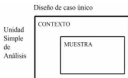
Figura 1. Estudio de casos tipo 1 (Yin, 2014)