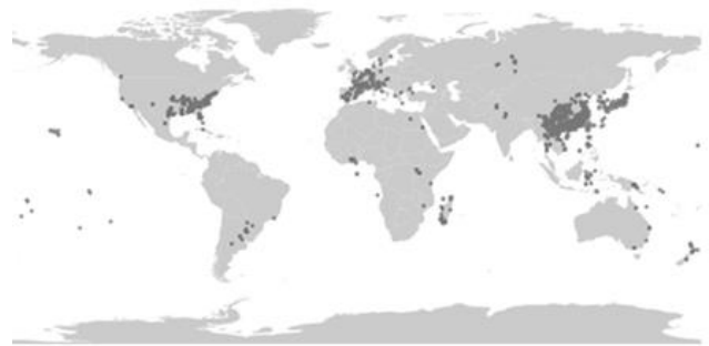
Figura 1. Distribución de Broussonetia papyrifera en el mundo.

En la provincia de Toledo se ha detectado una población naturalizada de B. papyrifera en la ribera de río Tajo (Santiago de Villarrubia) (Figuras 2, 3 y 4). Se ha depositado un pliego testigo en el Herbario de la Universidad de Granada (GDA). En el presente trabajo se discuten algunos aspectos generales relacionados con la especie, y se realizan valoraciones sobre la población encontrada.