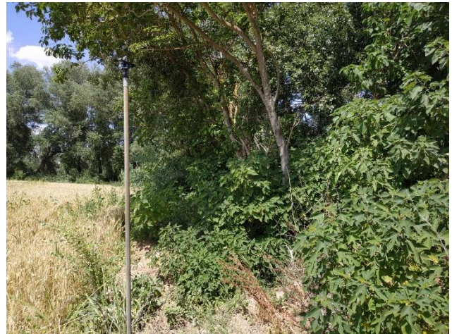
Figura 3. Imagen de la población de B. papyrifera detectada. Al fondo se aprecia una chopera de Populus alba .

de zonas. En ese periodo, solo se ha encontrado una referencia que alude a una posible naturalización (Laguna, 1870), concretamente en Montealegre (provincia de Barcelona), donde se habla de ejemplares con “aspecto de asilvestrados ”. Casi 100 años después, varios autores coincidieron en que crecía cultivada en jardines, pero que puntualmente podía naturalizarse (Bolós & Vigo 1990; Castroviejo 1993). En la actualidad, está incluida en la flora alóctona de España (Sanz-Elorza et al. 2004).