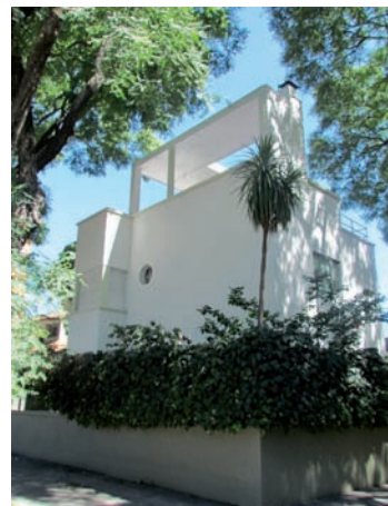
Vivienda Souto. C. Gómez Gavazzo, C. Molins, 1928

que implica un edificio público. En la mayoría de los casos se apela a una referencia al pasado en forma implícita que no llega a distorsionar el carácter renovador de la obra. El Palacio Municipal evoca los ayuntamientos medievales con su torre exenta pero a su vez se vincula con las arquitecturas de Dudok en su resolución general o de Frank Lloyd Wright en sus esquinas. En los casos del Banco de Seguros y de la sede de ANCAP, la integración se da con la tradición a partir de la resolución tripartita de los edificios, y de cierta monumentalidad que no afecta el carácter austero de sus fachadas.