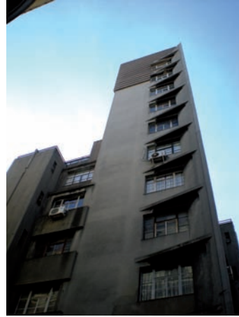
Edificio Centenario. O. De los Campos, M. Puente, H. Tournier, 1929

el desarrollo de otro tipo de ideas en nuestro medio.