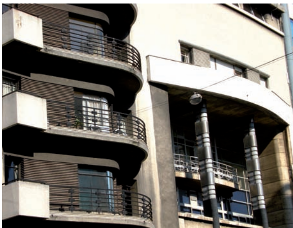
Edificio Confitería La Americana. Carlomagno, Bouza, González Fruniz, 1937