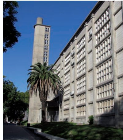
Facultad de Ingeniería. J. Vilamajó, 1936

fue una de las primeras respuestas renovadoras, si bien no totalmente consolidada, con una vinculación temprana al Art Decó. La Casa Barth (C. Surraco, Topolansky, 1925-27) con su amplia vidriera y sus volúmenes verticalizantes, el Edificio Tapié (F. Vázquez Echeveste, 1933) con sus espacios y detalles ornamentales, el Ateneo Popular y el Palacio Díaz con sus volúmenes escalonados en sus respectivas escalas, o la riqueza de los ornamentos del Palacio Rinaldi marcan claramente la importancia de esta vertiente. La variante de arquitectura náutica está presente, a su vez, en el Edificio El Mástil o el Yacht Club, ajustando la adopción de esta alternativa a su ubicación o a la función específica a cumplir.