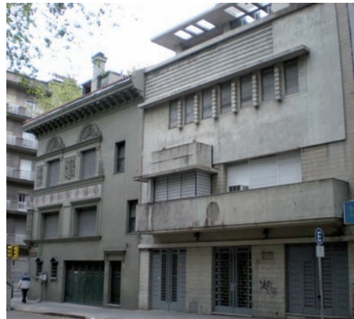
Vivienda Artucio. L. Artucio, R. Vázquez, 1931

del contexto: una avenida monumental y una calle común.