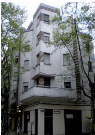
Edificio Michelini. R. Mainero, 1930