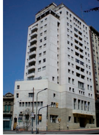
Centro Militar. B. Arbeleche, M. Canale, 1942

Se puede decir con propiedad que la arquitectura moderna montevideana contribuye a la construcción de la ciudad de Montevideo. No plantea una realidad alternativa, indiferente de lo existente, sino que proyecta un enriquecimiento de ese espacio público consolidado y de singular valor, y de una sociedad pujante y renovadora.