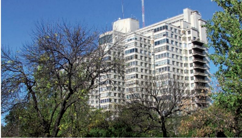
Hospital de Clínicas. C. Surraco, 1930