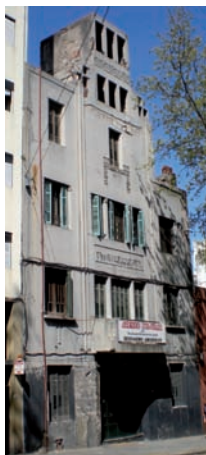
Edificio Ateneo Popular