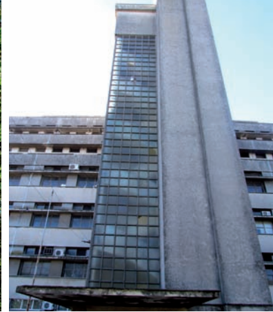
Instituto de Higiene. C. Surraco, 1933

Otro grupo de edificios destacados bajo los mismos parámetros son los dedicados a la atención de la salud: el Hospital de Clínicas (C. Surraco, 1930, concurso) y los Institutos de Higiene (C. Surraco, 1933 – 1951) y de Traumatología (C. Surraco) generando en su sector de implantación una suerte de ágora de modernidad experimental para el mejoramiento de la sanidad nacional.