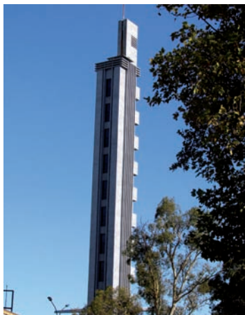
Estadio Centenario, Torre de los Homenajes. J. Scasso, 1930