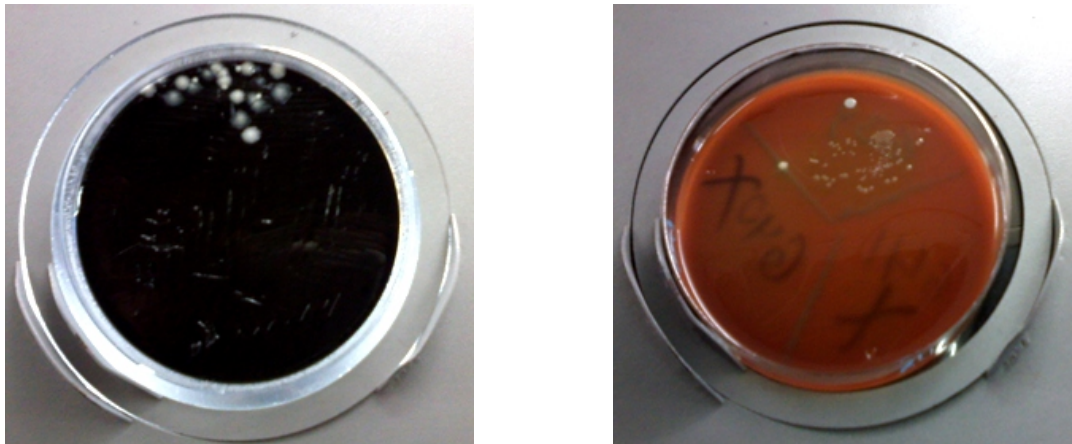
Figura 1. Crecimiento de Campylobacter spp en ASF (derecha) en comparación con AK (izquierda)