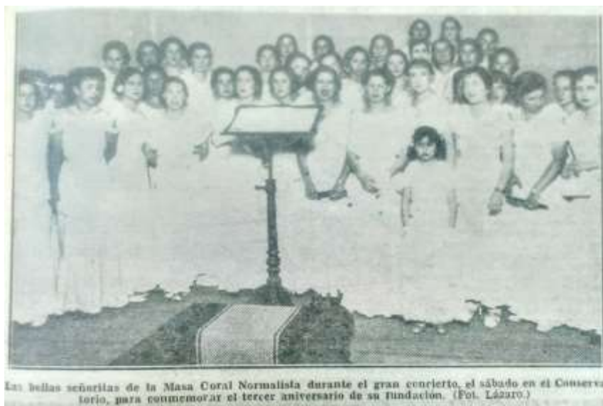
Imagen 2. Masa Coral Normalista (voces blancas) en el concierto del 3r aniversario de su fundación en junio de 1935. Fuente gráfica, Las Provincias , 21 de junio de 1935.

Cançó de la Renaixença , de M. Palau (coro mixto a 6 voces)