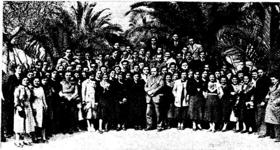
Imagen 1: Masa Coral Normalista en su visita a Sevilla.

En febrero de ese mismo año, la Masa Coral Normalista y la Orquesta de Cámara de Valencia , volvieron a colaborar con la programación de una audición escolar de folklore, en esta ocasión a beneficio de la cantina normalista . El concierto se estructuró de nuevo en tres secciones y las obras cantadas a capella procedían del folklore valenciano y catalán: 7