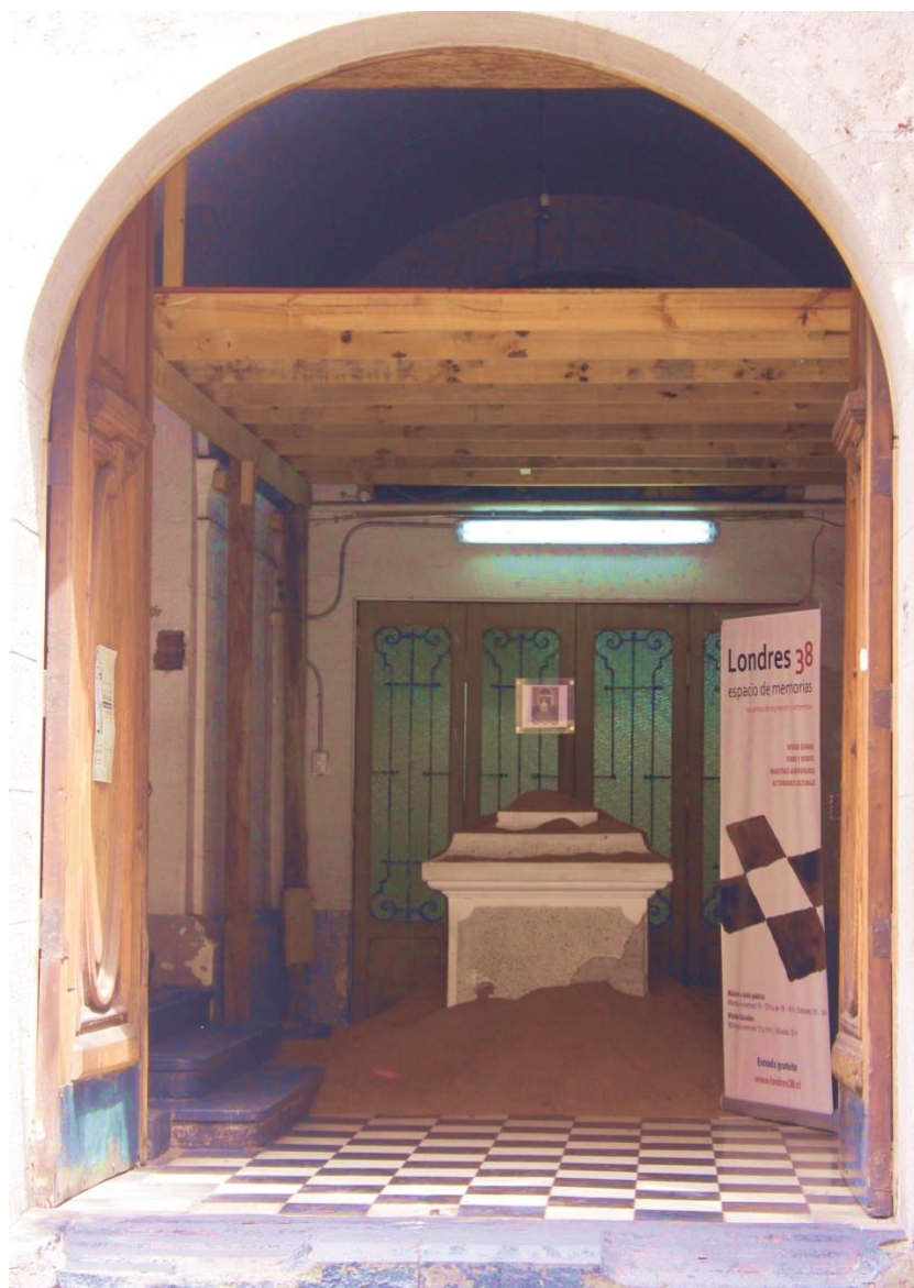
Imagen 4. Intervención Neltume señala el camino en Londres 38. Espacio de memorias.