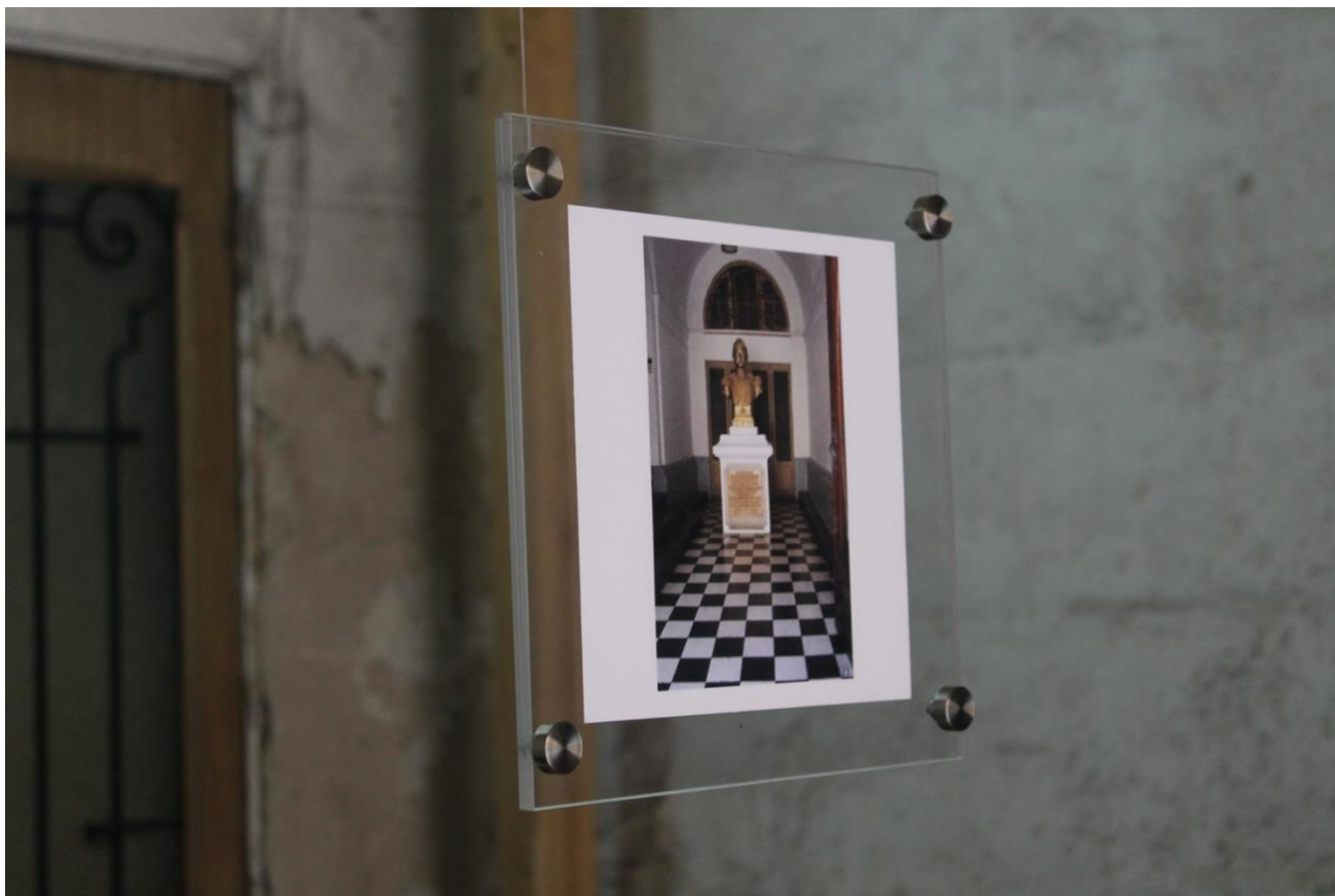
Imagen 3. Intervención Neltume señala el camino en Londres 38. Espacio de memorias.