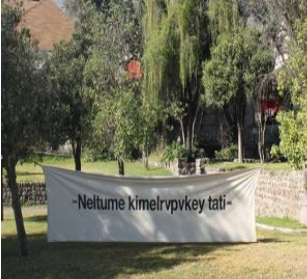
Imagen 1. Neltume kimelrupvkey tati, Parque por la Paz Villa Grimaldi, 2018.