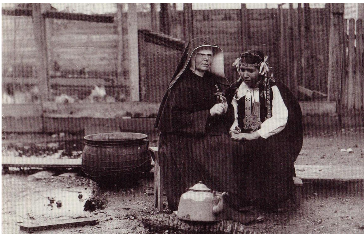
Imagen 6. Fotografía anónima, s/f. Archivo Centro Cultural y Memoria de Neltume. Cedita por el Colectivo Catrileo+Carrión.