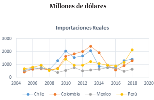
Gráfico 1. Intercambio Comercial entre los países miembros de la AP (2005-2018)

En el gráfico 1 se puede observar dos momentos del intercambio comercial de los cuatro países miembros a la AP, representado por el total de importaciones y exportaciones reales que realizan con cada uno de los países miembros. Un primer momento sucede en el periodo que comprende 2005-2010 cuando aún no existía la iniciativa de integración regional y, un segundo momento, cuando forman parte de esta iniciativa y empieza el camino hacia una libre circulación de bienes, servicios, capital y personas, el periodo 2011-2018.