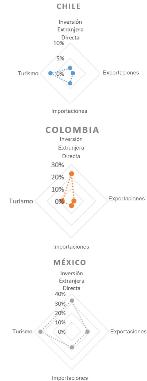
Figura 1. Determinantes de la importancia económica para Costa Rica de los países miembros de la Alianza del Pacífico.

Cada indicador posee una ponderación diferenciada dentro de las cuatro variables establecidas, mostrándose en la tabla anterior la ponderación total por país a lo largo del periodo de estudio (2011-2018).