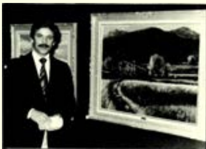
A. CARNICE (Galeria Rovira)

El fet coincident de l'aparició de l'esmentada obra amb la d'aquest número de Quadern no ens permet dedicar-li un comentari més extens. Hom ha pogut constatar que es tracta d'un acurat volum que, pel seu contingut, està destinat a gaudir d'una bona acceptació.