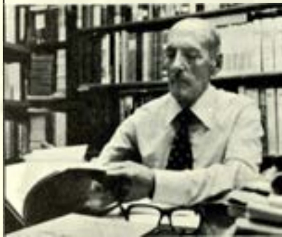
Edició d'Homenatge Sabadell - 1979